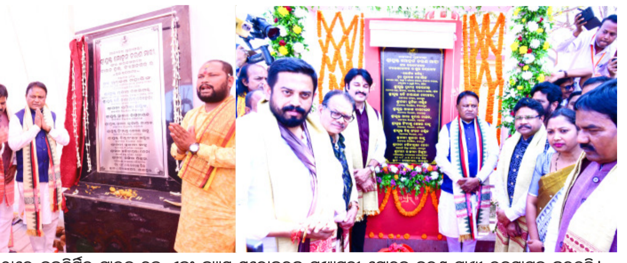
ଯାଜପୁର : ବ୍ୟାସନଗର ଠାରେ ନବନିର୍ମିତ ଟାଉନ ହଲ୍ ଏବଂ ବ୍ୟାସ ସରୋବରକୁ ମୁଖ୍ୟମନ୍ତ୍ରୀ ମୋହନ ଚରଣ ମାଝୀ ଉଦଘାଟନ କରୁଛନ୍ତି ।

ଭୁବନେଶ୍ୱର ୦୯ ଫେବୃୟାରୀ ରବିବାର, ୨୦୨୪ RNI Regd. No. : 52640/94 Postal Regd. No. : BN/60/25-27