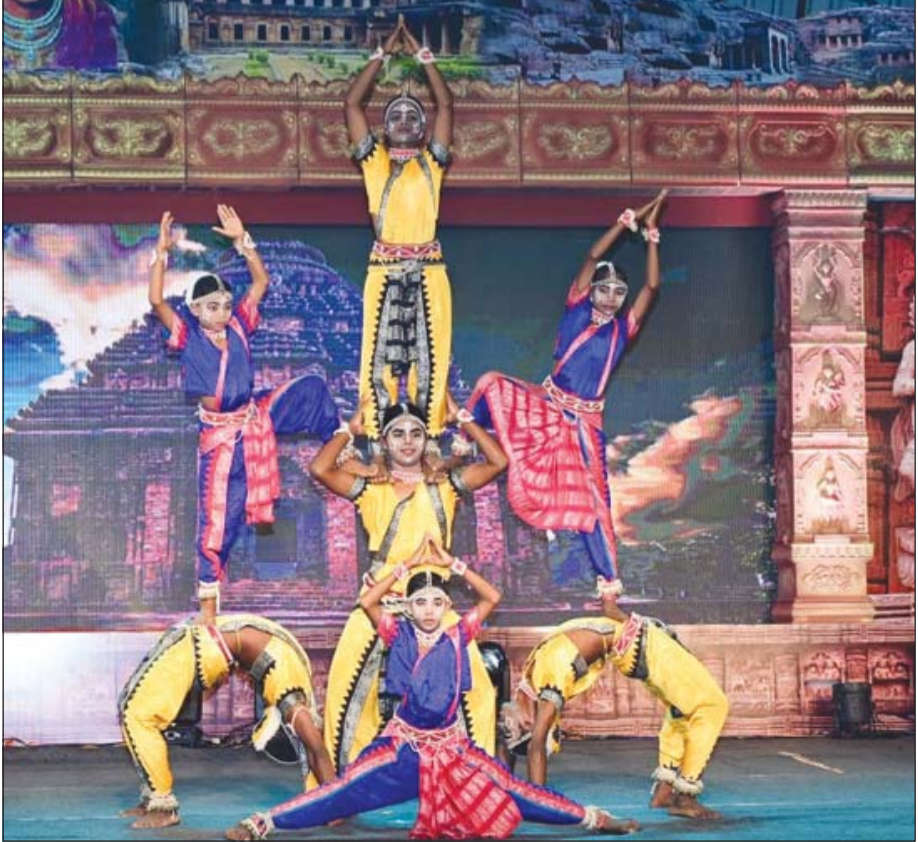
ଭୁବନେଶ୍ୱର : ଖଣ୍ଡଗିରି ପତ୍ତିକା ପରିସରରେ ଉତ୍ସବନାୟକାଳୀ ଧାରଣାରେ ମହୋତ୍ସବ-୨୦୨୫ ପାଳନ ଅବସରରେ ମୂର୍ତ୍ତିନା ଅନୁଷ୍ଠାନ କଳାକାରଙ୍କ ଦ୍ୱାରା ଗୋଟିପୁଅ ନୃତ୍ୟ ପରିବେଷଣ ।

ଭୁବନେଶ୍ୱର ମେଫେୟାରରେ ରହୁଥିବାରୁ ଅଭ୍ୟାସ ଓ ରବିବାର ମ୍ୟାଚ ପାଇଁ ପରିବହନ କରିବାକୁ ଓସିଏ ପକ୍ଷରୁ ସ୍ୱତନ୍ତ୍ର ବ୍ୟବସ୍ଥା କରାଯାଇଛି । ଓସିଏ ପକ୍ଷରୁ ୫ଟି ସ୍ୱତନ୍ତ୍ର ବସ୍ ସହ କିଛି ଲମୋରା ଗାଡି କମିଶନରେ ଯୋଗିତ୍ୱ ହସ୍ତାନ୍ତର କରାଯାଇଛି । ଷ୍ଟାଡ଼ିୟମରେ ମଧ୍ୟ ଖେଳାଳିଙ୍କ ଅଭ୍ୟାସ ପାଇଁ ବ୍ୟାପକ ବ୍ୟବସ୍ଥା କରାଯାଇଛି । ଉଭୟ ଦଳର କମିଶନରେ ପୁଲିସ ପକ୍ଷରୁ ୫୦ ପ୍ଲାଟ୍ଟିନିୟମ ଫୋର୍ସ ମୁଦ୍ରଣ କରାଯିବ । ଅଭ୍ୟାସ ପାଇଁ ସ୍ୱତନ୍ତ୍ର ପିଟ ନିର୍ମାଣ ହୋଇଥିବା ବେଳେ ପୁଲିସ ପକ୍ଷରୁ କଡ଼ା ସୁରକ୍ଷା ବ୍ୟବସ୍ଥା କରାଯାଇଛି । ଶନିବାର ଖେଳାଳିମାନଙ୍କ ଅଭ୍ୟାସ ଦେଖିବା ପାଇଁ ଦର୍ଶକମାନଙ୍କୁ ଷ୍ଟାଡ଼ିୟମରେ ଖାଲେରି ନିର୍ଦ୍ଦେଶ ଦେବାକୁ କରାଯାଇଛି । ଦର୍ଶକଙ୍କ ଭିଡ଼କୁ ଅନୁମୋଦନ କରି ଆବାଶ୍ୟକୀୟ ସୁରକ୍ଷା ବ୍ୟବସ୍ଥା କରାଯାଇଛି । ମ୍ୟାଚ ପାଇଁ କମିଶନରେ ପୁଲିସ ପକ୍ଷରୁ ୫୦ ପ୍ଲାଟ୍ଟିନିୟମ ଫୋର୍ସ ମୁଦ୍ରଣ କରାଯିବ ।