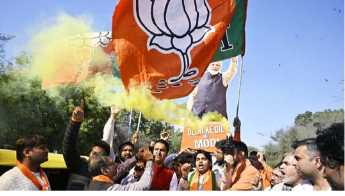
ଜିତିଥିଲା । ୧୯୯୩ରୁ ୧୯୯୮ ମଧ୍ୟରେ ବିଜେପି ୩ ଜଣ ମୁଖ୍ୟମନ୍ତ୍ରୀଙ୍କୁ ଶାସନ ଭାର ଦେଇଥିଲା । ପ୍ରଥମେ ମଦନ ଲାଲ ଖୁରାନା, ତାପରେ ସାହିବ ସିଂହ ବର୍ମା ଓ ଶେଷ କିଛି ମାସ ପ୍ରସନ୍ନା ସୁରଜ ମୁଖ୍ୟମନ୍ତ୍ରୀ ହୋଇଥିଲେ । ୧୯୯୮ ପରଠାରୁ ଆଜି ବିଜେପି କ୍ଷମତାକୁ ଫେରି ପାରି ନାହିଁ । ପ୍ରଥମେ କଂଗ୍ରେସ ୧୫ ବର୍ଷ ଧରି ଦିଲ୍ଲୀକୁ ଶାସନ କରିଥିଲା । ଏହାପରେ ଅରବିନ୍ଦ କେଜ୍ରିୱାଲଙ୍କ ଆପ ଅଧୀନ ଅନେକ ହେଲିଫ୍ରେଟ ବିଜେପି ପ୍ରାର୍ଥୀଙ୍କ ଆଗରେ (ପୃଷ୍ଠା ୭ରେ)