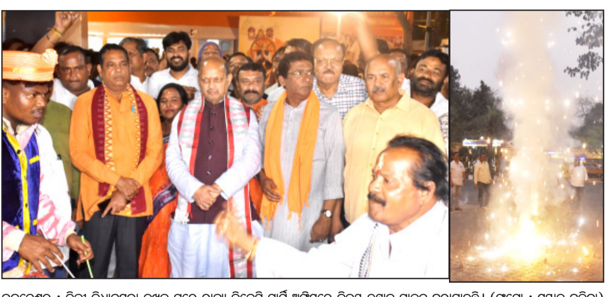
ଭୁବନେଶ୍ୱର : ଦିଲ୍ଲୀ ବିଧାନସଭା ଦକ୍ଷଳ ପରେ ରାଜ୍ୟ ବିଜେପି ପାର୍ଟି ଅଫିସରେ ବିକଳ ଉତ୍ସାବ ପାଳନ କରାଯାଇଛି ।

ତେବେ ବାପା-ପୁଅଙ୍କୁ ଗୁରୁତର ଅବସ୍ଥାରେ କଟକ ବଡ଼ ମେଡିକାଲକୁ ସ୍ଥାନାନ୍ତର କରାଯାଇଥିଲା । ହେଲେ ବହୁତ ଡେରି ହୋଇଯାଇଥିଲା । ଉଭୟଙ୍କୁ ବକ୍ଷାଳ ପରିନଥିଲେ ତାହାର । ମୃତ ଘୋଷଣା କରିଥିଲେ । ତେବେ ସ୍ୱାକ୍ ଅବସ୍ଥା ଠିକ ଥିବା ଜଣାପଡିଛି । ସ୍ୱାମୀ ଓ ପୁଅକୁ ହରାଇ ଯୌସିନ୍ଦରା ହୋଇପଡିଛନ୍ତି ମହିଳା । ରାଷ୍ଟ୍ରରେ ଭୋ ଭୋ ହୋଇ କାନ୍ଦୁଥିବାର ଦେଖିବାକୁ ମିଳିଥିଲା । ସ୍ଥାନୀୟ ଲୋକେ ତାଙ୍କୁ ଧରି ବୁଝାସୁଝା କରିଛନ୍ତି । ତେବେ ଦୁର୍ଘଟଣା ଘଟାଇ ଫେରାର ହୋଇଯାଇଛି ଟ୍ରକ ଡ୍ରାଇଭର । ମୃତଦେହ କଟକ ଜରି ହୋଇ ଧକ୍କା ଦେଇଥିଲା ଟ୍ରକ ।