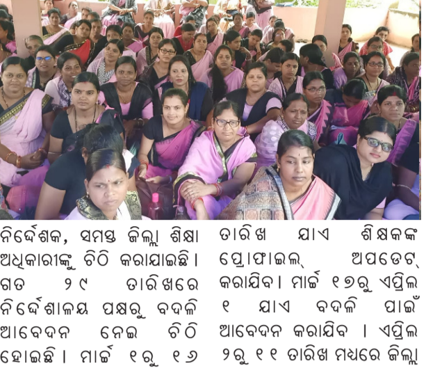
ନିର୍ଦ୍ଦେଶକ, ସମସ୍ତ ଜିଲ୍ଲା ଶିକ୍ଷା ଅଧିକାରୀଙ୍କୁ ଚିଠି କରାଯାଇଛି । ଗତ ୨୯ ତାରିଖରେ ନିର୍ଦ୍ଦେଶାଳୟ ପକ୍ଷରୁ ବଦଳି ଆବେଦନ ନେଇ ଚିଠି ହୋଇଛି । ମାର୍ଚ୍ଚ ୧୭ ୧୬

ଭୁବନେଶ୍ୱର, ନ୍ୟୁଜ୍ ବ୍ୟୁରୋ ମାର୍ଚ୍ଚ ୯ ତାରିଖରୁ ଆରମ୍ଭ ହେବ ପ୍ରାଥମିକ ଶିକ୍ଷକ ବଦଳି ପ୍ରକ୍ରିୟା । ମାର୍ଚ୍ଚ ୧୭ ତାରିଖରୁ ଅନୁଲାଇନ୍ ଆବେଦନ ଆରମ୍ଭ ହେବ । ଏପ୍ରିଲ ୧ ତାରିଖ ମଧ୍ୟରେ ଆବେଦନ କରିବାର ସୁଯୋଗ ମିଳିବ । ଡିଭିଏଓ ବିଭାଗକୁ ଦ୍ୱାରା ଆବେଦନ ପତ୍ର ଯାଞ୍ଚୁ ଆରମ୍ଭ କରି ତାହାର ପରୀକ୍ଷା ସବୁ ହେବ । ଶିକ୍ଷକ ବଦଳି ନିର୍ଦ୍ଦେଶ ବାହାରିବା ପରେ ପୋଷ୍ଟିଂ ସହ ସମସ୍ତ ପ୍ରକ୍ରିୟା ଜୁନ ୨୧ ସୁଦ୍ଧା ଶେଷ ହେବ । ଏନେଇ ପ୍ରାଥମିକ ଶିକ୍ଷା ନିର୍ଦ୍ଦେଶାଳୟ ପକ୍ଷରୁ ଓପେସା ରାଜ୍ୟ ପ୍ରକଳ୍ପ