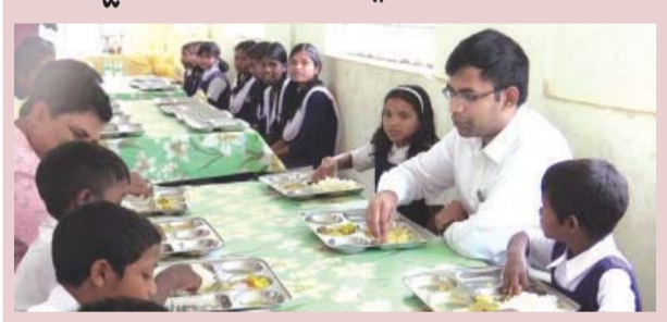
କୋରାପୁଟ ୮/୨ ନ୍ୟୁଜ୍ ବ୍ୟୁରୋ ଅଧିକାରୀ ଭୂଲରେ ପହଞ୍ଚିଲେ ।