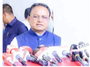
ପରିବର୍ତ୍ତନ କରିବା ଅନ୍ତୋଦୟ ଗୃହ ଯୋଜନାର ମୂଳ ଲକ୍ଷ୍ୟ । ଏହି ଯୋଜନା ପାଇଁ ୭,୫୫୦ କୋଟି ଟଙ୍କାର ବ୍ୟୟ ବରାଦ କରାଯାଇଛି । ପ୍ରାକୃତିକ ଅଥବା ମନୁଷ୍ୟକୃତ ବିପର୍ଯ୍ୟୟରେ କ୍ଷତିଗ୍ରସ୍ତ ପରିବାର, ବିଭିନ୍ନ ଦେଇ ସେମାନଙ୍କ ଜୀବନ ଧାରଣର ମାନ

ଭୁବନେଶ୍ୱର, ୮୨ ନୂଆ ବିଧାନ ମୁଖ୍ୟମନ୍ତ୍ରୀ ମୋହନ ଚରଣ ମାଝିଙ୍କ ଅଧିକାରରେ ଶୁକ୍ରବାର ଲୋକସେବା ଭବନରେ ଅନୁଷ୍ଠିତ ମନ୍ତ୍ରୀମଣ୍ଡଳ ବୈଠକରେ ଅନୁମୋଦନ ଲାଭ କରିଥିବା ୧୧ଟି ପ୍ରସ୍ତାବ ସମ୍ପର୍କରେ ଶନିବାର ପୂର୍ବାହ୍ନରେ ମୁଖ୍ୟମନ୍ତ୍ରୀ ଗଣମାଧ୍ୟମ ପ୍ରତିନିଧିଙ୍କୁ ବିସ୍ତୃତ ସୂଚନା ଦେଇଛନ୍ତି । ସେ କହିଛନ୍ତି କ୍ୟାବିନେଟ୍ ବୈଠକରେ ଅନ୍ତୋଦୟ ଗୃହ ଯୋଜନା ସମ୍ପର୍କରେ ପ୍ରସ୍ତାବକୁ ଅନୁମୋଦନ ଦିଆଯାଇଛି । ସମାଜର ଦୁର୍ବଳ ବର୍ଗର ଲୋକମାନଙ୍କୁ ପଲ୍ଲୀଭାର ଯୋଗାଇ ଦେଇ ସେମାନଙ୍କ ଜୀବନ ଧାରଣର ମାନ