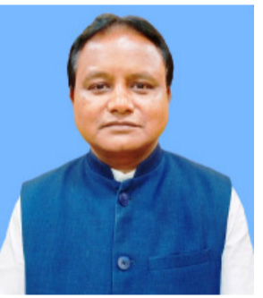
ଏହି ଭିଜନ କେବଳ ବିକାଶ ଓ ପ୍ରଗତି ଦିଗରେ ଏକ ଗୁରୁତ୍ୱପୂର୍ଣ୍ଣ

ଭୁବନେଶ୍ୱର, ୮/୨ ନ୍ୟୁଜ୍ ବ୍ୟୁରୋ ବିଜେପିର ବିଜୟ ପାଇଁ ଦିଲ୍ଲୀବାସୀଙ୍କୁ ଶୁଭେଚ୍ଛା ଜଣାଇଛନ୍ତି ମୁଖ୍ୟମନ୍ତ୍ରୀ ମୋହନ ଚରଣ ମାଝୀ । ଏହା ହାତୀଖେଳରେ ମୁଖ୍ୟମନ୍ତ୍ରୀ କହିଛନ୍ତି ଯେ, ଦିଲ୍ଲୀବାସୀଙ୍କୁ ହାଜି କ ଶୁଭକାମନା । ଆପଣ ସମସ୍ତଙ୍କ ଜର୍ଜନ ସରକାର ଗଠନର ଐତିହାସିକ ସମୟ ଆସିଛି ।