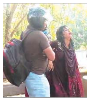
କଟକ ଶିଖରପୁର ଅଞ୍ଚଳର ଜାତୀୟ ରାଜପଥରେ ଘଟିଛି ମର୍ତ୍ତ୍ୟୁ ଦୁର୍ଘଟଣା । ବାଇକରେ ସ୍ୱାମୀ-ସ୍ତ୍ରୀ ଓ ୫ ବର୍ଷର ପୁଅ ଟ୍ରକ୍‌ରେ ଘାତୀ ହୋଇଥିଲେ । ହଠାତ ଧକ୍କା ଦେଇଥିଲା ଟ୍ରକ ।

କଟକ ୮/୨ ନ୍ୟୁଜ୍ ବ୍ୟୁରୋ କେତେ ହସଖୁସିରେ ଏକାଠି ଯାଉଥିଲେ । କ'ଣ ହେଲା ତାହା କିଏ ଜାଣିପାରି ପାରୁନାହିଁ । କିଏ ଜାଣିଥିଲା ବାଟରେ ଜରିଛି ଟ୍ରକ ଭୁପରେ ଯମ । ମାଆ ସାମ୍ନାରେ ଚାଲିଯାଇଛି ବାପା-ପୁଅଙ୍କ ଜୀବନ ।