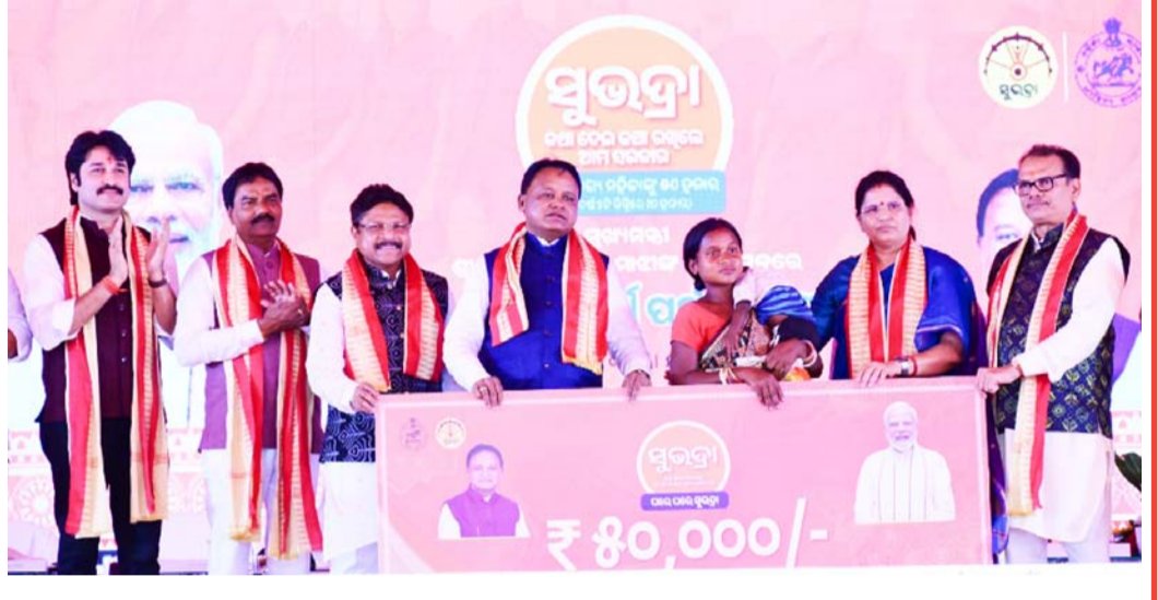
ଅବସରରେ ମୁଖ୍ୟମନ୍ତ୍ରୀ କହିଛନ୍ତି ଯେ, ସୁଭଦ୍ରା ଯୋଜନାରେ ମା'ମାନଙ୍କୁ ୨ଟି କିଛିରେ ବର୍ଷକୁ ୧୦ ହଜାର ଟଙ୍କା ଲେଖାଏଁ ୫ ବର୍ଷରେ ୫୦ ହଜାର ଟଙ୍କା ପ୍ରଦାନ କରିବାର ବ୍ୟବସ୍ଥା କରାଯାଇଛି । ଏହି ସହାୟତା ରାଶି ପ୍ରଦାନର ଉଦ୍ଦେଶ୍ୟ ରହିଛି ମା'ମାନଙ୍କୁ ବିକାଶର ପାର୍ଟନର କରିବା, ମା'ମାନେ ଏହାକୁ ପାରିବାରିକ ଖର୍ଚ୍ଚ ପାଇଁ ବ୍ୟବହାର ନ କରି ବିଭିନ୍ନ ବିଜ୍ଞାନେୟ ପାଇଁ ବିନିଯୋଗ କରିବାକୁ ମୁଖ୍ୟମନ୍ତ୍ରୀ ପରାମର୍ଶ ଦେଇଛନ୍ତି । ମୁଖ୍ୟମନ୍ତ୍ରୀ କହିଛନ୍ତି ଯେ, ନାରୀର ଶକ୍ତି ସାମର୍ଥ୍ୟ ଏବଂ (ପୃଷ୍ଠା ୭ରେ)

ଭୁବନେଶ୍ୱର/ଯାଜପୁର, ୮୨ ନୂଆ ବିଧାନ ଶନିବାର ଯାଜପୁରରେ ସୁଭଦ୍ରା ଯୋଜନାର ଚତୁର୍ଥ ପର୍ଯ୍ୟାୟର ପ୍ରଥମ କିଛି ଆର୍ଥିକ ସହାୟତା ପ୍ରଦାନ କରାଯାଇଛି । ଓଡ଼ିଶାର ସର୍ବବୃହତ୍ ମହିଳା ସଶକ୍ତିକରଣ ଯୋଜନା ସୁଭଦ୍ରା ଅଧୀନରେ ଯାଜପୁରରେ ଶନିବାର ମୁଖ୍ୟମନ୍ତ୍ରୀ ମୋହନ ଚରଣ ମାଝି ୧୮ ଲକ୍ଷ ନୂତନ ହିତାଧିକାରୀଙ୍କୁ ୫ ହଜାର ଟଙ୍କା ଲେଖାଏଁ ଆର୍ଥିକ ସହାୟତା ପ୍ରଦାନ କରିଛନ୍ତି । ଏହି ସହାୟତା ରାଶି ହିତାଧିକାରୀଙ୍କ ବ୍ୟାଙ୍କ ଆକାଉଣ୍ଟକୁ ତିନିଟି ମାସ ମଧ୍ୟରେ ହସ୍ତାନ୍ତର କରାଯାଇଛି । ପୂର୍ବରୁ ୩ଟି ପର୍ଯ୍ୟାୟରେ ୮୦ ଲକ୍ଷ ମହିଳା ପ୍ରଥମ କିଛି ପାଇଥିବା ବେଳେ, ଆଜିକୁ ମିଶାଇ ୪ଟି ପର୍ଯ୍ୟାୟରେ ୯୮ ଲକ୍ଷ ମହିଳା ସୁଭଦ୍ରା ଯୋଜନାରେ ସହାୟତା ପାଇଲେ । ଏହି ସହାୟତା ରାଶି ପ୍ରଦାନ