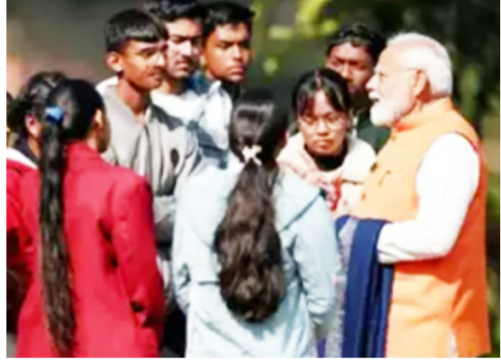
ଦେଲେ ସହକର୍ତ୍ତା ନିଶ୍ଚୟ ମିଳିବ । ତେବେ ପ୍ରଧାନମନ୍ତ୍ରୀ ବୋର୍ଡ ପରୀକ୍ଷା ପାଇଁ ପ୍ରସ୍ତୁତି କରୁଥିବା ଛାତ୍ରଛାତ୍ରୀ, ସେମାନଙ୍କ ଅଭିନେତ୍ରୀ ଦାସିକା ପାଠୁକୋନ ଓ ଭୂମି ଅଭିଭାବକ ଏବଂ ଶିକ୍ଷକ ଶିକ୍ଷଣିତ୍ରୀଙ୍କ ସହ

ନୂଆଦିଲ୍ଲୀ, ୧୦୧୨ ପ୍ରଧାନମନ୍ତ୍ରୀଙ୍କ 'ପରୀକ୍ଷା ପେ ଚଳା' ଏହି କାର୍ଯ୍ୟକ୍ରମ ମାଧ୍ୟମରେ ପିଏମ ମୋଦି ପରୀକ୍ଷାର୍ଥୀମାନଙ୍କୁ କହିଛନ୍ତି କେବେ କେବେ ନିଜ ସହ କଥା ହେବା ଉଚିତ୍ । ଯେଉଁଠି କେହି ନ ଥିଲେ ସେଠି ଆପଣ ସହସ୍ତୁ, ନେତୃତ୍ୱ ନେଇପାରିବେ । ଉତ୍ତର ସାମ୍ବଲପୁର ପାଇଁ ମଧ୍ୟ ପରୀକ୍ଷାର୍ଥୀ ମାନଙ୍କୁ ଚିପ୍ପ ଦେଇଛନ୍ତି ପ୍ରଧାନମନ୍ତ୍ରୀ ମୋଦି । ପିଲାଙ୍କୁ ଉପଯୁକ୍ତ କରିବାକୁ ଅଭିଭାବକ ଓ ଶିକ୍ଷକମାନଙ୍କୁ ବାର୍ତ୍ତା ଦେଇଛନ୍ତି । ପିଲାଙ୍କ ଚାଲେଷ୍ଟ ଦେଖି ସେହି ଆଧାରରେ ବର୍ତ୍ତିବାକୁ ସହଯୋଗ କରନ୍ତୁ । ପରୀକ୍ଷା ଜୀବନରେ ସବୁ କିଛି, ତାହା ଭାବିବା ଭୁଲ । ଲେଖୁବାର ଅଭାବ ଥିଲେ ପରୀକ୍ଷାରେ ଲେଖିବାକୁ କଷ୍ଟ ହେବନି । ଛାତ୍ରଛାତ୍ରୀମାନେ ସମୟର ସଫଳଯୋଗ କରିବା ଉଚିତ୍ ଏବଂ ଟୀକାମ ମ୍ୟାନେଜମେଣ୍ଟ କରିବା ଶିଖିବା ଦରକାର । ଅଧିକ ନ ଭାବି ବର୍ତ୍ତମାନ ସମୟରେ ଧ୍ୟାନ