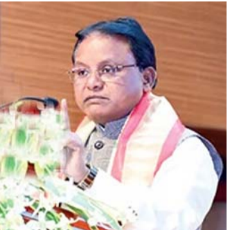
କ୍ରିପିଏଲ୍‌ଏଫମାନେ ସ୍ୱୟଂ ସହାୟକ ହୋଇପାରି ନାହାନ୍ତି । ତେଣୁ କମ୍ପ୍ୟୁଟି ସପୋର୍ଟ ଷ୍ଟାଫ ୧୦ ମାସ ଧରି ପାରିଶ୍ରମିକ ପାଇପାରି ନାହାନ୍ତି । ମୁଖ୍ୟମନ୍ତ୍ରୀ କହିଥିଲେ ଆମ ସରକାର ମାଆ ମାନଙ୍କର ସମସ୍ୟା ପ୍ରତି ସମ୍ବେଦନଶୀଳ ଅଛନ୍ତି । ସ୍ୱୟଂ ସହାୟକ ଗୋଷ୍ଠୀର ମହିଳାମାନଙ୍କର ଆର୍ଥିକ ଅଭିବୃଦ୍ଧି କରାଇବା ପାଇଁ କମ୍ପ୍ୟୁଟି ସପୋର୍ଟ ଷ୍ଟାଫମାନଙ୍କୁ ପଞ୍ଚାୟତସଭାରେ ସଂଘ ଦ୍ୱାରା ନିଯୁକ୍ତ କରାଯାଇଥିଲା । ସେମାନଙ୍କ ମଧ୍ୟରେ ସିଆରସି-ସିଏମ୍ ମାଷର ବୁକ୍ କିପର, ବ୍ୟାଙ୍କ ମିଡ଼ି ଓ ପ୍ରାଣୀ ମିଡ଼ି ଅନ୍ତର୍ଭୁକ୍ତ । ରାଜ୍ୟରେ ଏସିଆର ସର୍ବବୃହତ ଏରୋସ୍ପେସ ଏବଂ ପ୍ରତିରକ୍ଷା ପ୍ରଦର୍ଶନୀ ଏବୋ ଲକ୍ଷିଆର ୧୫ତମ (ପୃଷ୍ଠା ୭ରେ)

ଭୁବନେଶ୍ୱର, ୧୫/୨ ବୁଧିଜ୍ଞ ବ୍ୟବସାୟ ଶୁକ୍ରବାର ବିଧାନସଭାରେ ମୁଖ୍ୟମନ୍ତ୍ରୀ ମୋହନ ଚରଣ ମାଝୀ ବଡ଼ ଘୋଷଣା କରିଛନ୍ତି । ମୁଖ୍ୟମନ୍ତ୍ରୀ ଶ୍ରୀ ମାଝୀ ଗୃହରେ ବିଦୁରି ପ୍ରଦାନ କରି ଜାତୀୟ ଗ୍ରାମାଣ୍ଡ ଜୀବିକା ମିଶନ ଅଧିନରେ କାର୍ଯ୍ୟ କରୁଥିବା କମ୍ପ୍ୟୁଟି ସପୋର୍ଟ ଷ୍ଟାଫମାନଙ୍କ ନିଯୁକ୍ତି ଓ ପାରିଶ୍ରମିକ ସମ୍ପର୍କରେ ଗୃହକୁ ସୂଚନା ଦେଇଥିଲେ । ସେ କହିଥିଲେ ୨୦୧୨ ମସିହା ଏପ୍ରିଲ ୧ ତାରିଖରୁ ଜାତୀୟ ଗ୍ରାମାଣ୍ଡ ଜୀବିକା ମିଶନ ଅଧିନରେ ଓଡ଼ିଶା ଜୀବିକା ମିଶନ କାର୍ଯ୍ୟକାରୀ ହେଉଛି । ଏଥିରେ ଗ୍ରାମାଣ୍ଡ ପରିବାରମାନଙ୍କ ଜୀବନ ଜୀବିକାରେ ଉନ୍ନତି ପାଇଁ ସ୍ୱୟଂ ସହାୟକ ଗୋଷ୍ଠୀ ଗଠନ କରି ପରିବାରର ମହିଳାଙ୍କୁ ସାମିଲ କରାଯାଇଛି । ସ୍ୱୟଂ ସହାୟକ ଗୋଷ୍ଠୀ ଆଞ୍ଚଳିକ ମଞ୍ଚ ଏବଂ ଗ୍ରାମ ପଞ୍ଚାୟତ ସଂଘ ଗୁଡ଼ିକୁ ସୁଦୃଢ଼ ଓ ସଶକ୍ତ କରିବା ପାଇଁ କମ୍ପ୍ୟୁଟି ସପୋର୍ଟ ଷ୍ଟାଫମାନଙ୍କୁ ପଞ୍ଚାୟତସଭାରେ ସଂଘ ଦ୍ୱାରା ନିଯୁକ୍ତ କରାଯାଇଥିଲା । ସେମାନଙ୍କ ମଧ୍ୟରେ ସିଆରସି-ସିଏମ୍ ମାଷର ବୁକ୍ କିପର, ବ୍ୟାଙ୍କ ମିଡ଼ି ଓ ପ୍ରାଣୀ ମିଡ଼ି ଅନ୍ତର୍ଭୁକ୍ତ । ରାଜ୍ୟରେ ଏସିଆର ସର୍ବବୃହତ ଏରୋସ୍ପେସ ଏବଂ ପ୍ରତିରକ୍ଷା ପ୍ରଦର୍ଶନୀ ଏବୋ ଲକ୍ଷିଆର ୧୫ତମ (ପୃଷ୍ଠା ୭ରେ)