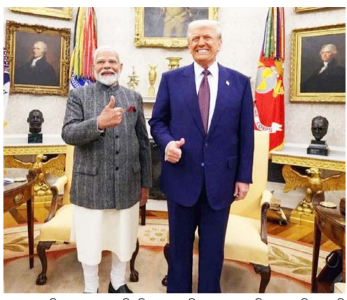
ସହଯୋଗ ବିଷୟରେ ଟ୍ରମ୍ କହିଛନ୍ତି ଯେ ଭାରତକୁ ଖୁବ୍ ଶୀଘ୍ର ଏଫ-୩୫ ଲଢୁଆ ବିମାନ ଯୋଗାଇ ଦିଆଯିବ । ପ୍ରଧାନମନ୍ତ୍ରୀ ମୋଦିଙ୍କ ସହ ଏକ ମିଳିତ ସାମ୍ବାଦିକ ସମ୍ମିଳନୀରେ ଆମେରିକା ରାଷ୍ଟ୍ରପତି ଟ୍ରମ୍ ଏହି କଥା କହିଛନ୍ତି । ତୋନାଲୁ ଟ୍ରମ୍ କହିଛନ୍ତି ଯେ ଆମେରିକା ଭାରତ ସହିତ ପ୍ରତିରକ୍ଷା ସହଯୋଗକୁ ଆହୁରି ବୃଦ୍ଧି କରିବ । ମିଳିତ

ନୂଆଦିଲ୍ଲୀ, ୧୫/୨ ଭାରତ-ଆମେରିକା ମିଳିତ ପ୍ରେସ୍ କନଫରେନ୍ସରେ ପ୍ରଧାନମନ୍ତ୍ରୀ ନରେନ୍ଦ୍ର ମୋଦି ଉଦ୍‌ବୋଧନ ଦେଇଛନ୍ତି । ପ୍ରଧାନମନ୍ତ୍ରୀ ମୋଦିଙ୍କୁ ଭବ୍ୟ ସ୍ୱାଗତ ଓ ଆତିଥେୟତା ପ୍ରଦର୍ଶନ କରିଥିବାରୁ ସେ ସର୍ବପ୍ରଥମେ ଆମେରିକାର ନିର୍ବାଚିତ ରାଷ୍ଟ୍ରପତି ଜୋନାହୁ ଟ୍ରମ୍‌ଙ୍କୁ ଧନ୍ୟବାଦ ଜଣାଇଥିଲେ । ଭାରତ ଓ ଆମେରିକାର ଦ୍ୱିପାକ୍ଷିକ ବାଣିଜ୍ୟିକ ସମ୍ପର୍କକୁ ମଜବୁତ କରିଥିବାରୁ ଟ୍ରମ୍‌ଙ୍କ ନେତୃତ୍ୱକୁ ମୋଦି ଧନ୍ୟବାଦ ଜଣାଇଥିଲେ ।