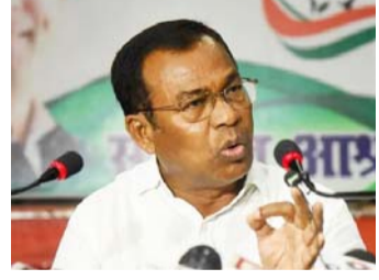
ଫେରିବାକୁ ଅନୁରୋଧ ମଧ୍ୟ ଜଣାଇଛନ୍ତି । ସାମାଜିକ ଗଣମାଧ୍ୟମ ଏକରେ ପୂର୍ଣ୍ଣ କରି ଶ୍ରୀ ଦାସ (ପୃଷ୍ଠା ୭ରେ)

ଭୁବନେଶ୍ୱର, ୧୫/୨ ବୁଧିଜ୍ଞ ବ୍ୟବସାୟ କଂଗ୍ରେସ ଦଳରୁ ସସପେଣ୍ଡ ଓ ବହିଷ୍କୃତ ହୋଇଥିବା ନେତାମାନେ ପୁଣିଥରେ ଦଳକୁ ଫେରିବେ । ଏଥିପାଇଁ ଓଡ଼ିଶା ପ୍ରଦେଶ କଂଗ୍ରେସ କମିଟି ପକ୍ଷରୁ ସର୍ବକ୍ଷମ ଅନୁରୋଧ ପତ୍ର ଜାରି କରାଯାଇଛି । ନୂଆ ପିସିସି ସଭାପତି ଭକ୍ତ ଚରଣ ଦାସ ଏନେଇ ବଡ଼ ନିଷ୍ପତ୍ତି ନେଇଛନ୍ତି । ପୂର୍ବ ବହିଷ୍କାର ଏବଂ ନିଲମନ ଆଦେଶ ପ୍ରତ୍ୟାହତ କରିଛନ୍ତି । ଏଥି ସହିତ ସେ ଦଳ ଛାଡ଼ିଥିବା ନେତାଙ୍କୁ ଦଳକୁ