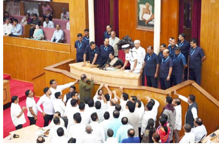
ସପ୍ତଦଶ ଓଡ଼ିଶା ବିଧାନସଭାର ତୃତୀୟ ତଥା ଚଳିତ ବଜେଟ ଅଧିବେଶନର ଶୁକ୍ରବାର ତୃତୀୟ ଦିବସ ବୈଠକ ଆରମ୍ଭରୁ ବିରୋଧୀ ଦଳ ଉଭୟ ବିଜେଡି ଏବଂ କଂଗ୍ରେସର ବିଧାୟକମାନେ ରାଜ୍ୟର ବିପର୍ଯ୍ୟସ୍ତ ଆଇନ ଶୃଙ୍ଖଳା ଏବଂ ଘଣ୍ଟା ସମସ୍ୟା ବିଷୟ ଉପରେ ଗୁହର ମଧ୍ୟଭାଗକୁ ଗୁଲିଆସି ନାରାବାଜି ଚଳାଇବାକୁ ଚୁମ୍ବକ ହଟଗୋଳ ସୃଷ୍ଟି ହୋଇଥିଲା । ବାରମ୍ବାର ପ୍ରଶ୍ନ ପାଠା ବିରୋଧୀ ବିଧାୟକମାନଙ୍କୁ ଗୁରୁତ୍ୱପୂର୍ଣ୍ଣ ପ୍ରଶ୍ନୋତ୍ତର କାର୍ଯ୍ୟକ୍ରମରେ (ପୃଷ୍ଠା ୭ରେ)

ଭୁବନେଶ୍ୱର, ୧୫/୨ ବୁଧିଜ୍ଞ ବ୍ୟବସାୟ ସପ୍ତଦଶ ଓଡ଼ିଶା ବିଧାନସଭାର ତୃତୀୟ ତଥା ଚଳିତ ବଜେଟ ଅଧିବେଶନର ଶୁକ୍ରବାର ତୃତୀୟ ଦିବସ ବୈଠକ ଆରମ୍ଭରୁ ବିରୋଧୀ ଦଳ ଉଭୟ ବିଜେଡି ଏବଂ କଂଗ୍ରେସର ବିଧାୟକମାନେ ରାଜ୍ୟର ବିପର୍ଯ୍ୟସ୍ତ ଆଇନ ଶୃଙ୍ଖଳା ଏବଂ ଘଣ୍ଟା ସମସ୍ୟା ବିଷୟ ଉପରେ ଗୁହର ମଧ୍ୟଭାଗକୁ ଗୁଲିଆସି ନାରାବାଜି ଚଳାଇବାକୁ ଚୁମ୍ବକ ହଟଗୋଳ ସୃଷ୍ଟି ହୋଇଥିଲା । ବାରମ୍ବାର ପ୍ରଶ୍ନ ପାଠା ବିରୋଧୀ ବିଧାୟକମାନଙ୍କୁ ଗୁରୁତ୍ୱପୂର୍ଣ୍ଣ ପ୍ରଶ୍ନୋତ୍ତର କାର୍ଯ୍ୟକ୍ରମରେ (ପୃଷ୍ଠା ୭ରେ)