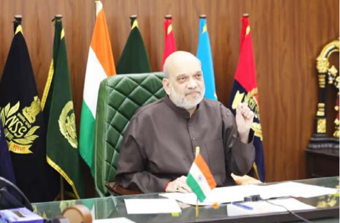
ହେବା ପରେ ପାକିସ୍ତାନରେ ପ୍ରବେଶ କରି ଆତଙ୍କବାଦୀଙ୍କୁ କଡ଼ା କବାଦ ଦେବାକୁ କହିଥିଲେ । ସେଥିପାଇଁ (ପୃଷ୍ଠା ୭ରେ)

ହଲଦ୍ୱାନୀ, ୧୫/୨ ପୁଲଝୁମା ଆକ୍ରମଣ ବାର୍ଷିକୀ ଅବସରରେ ଗୃହମନ୍ତ୍ରୀ ଅମିତ ଶାହ ସହିଦ ଯବାନଙ୍କୁ ମନେ ପକାଇଛନ୍ତି । ଭାରତର ସେନା ଏବଂ ସାମା ସହ ଖେଳ ଖେଳିବାକୁ ଚେଷ୍ଟା କର ନାହିଁ ବୋଲି ସେ ସ୍ପଷ୍ଟ ଭାଷାରେ ପାକିସ୍ତାନକୁ ଚେତାବନୀ ଶୁଣାଇଛନ୍ତି । ଉତ୍ତରାଖଣ୍ଡର ହଲଦ୍ୱାନୀରେ ଆୟୋଜିତ ‘୩୮ତମ ଜାତୀୟ କ୍ରୀଡ଼ା’ର ସମାପନୀ ସମାରୋହକୁ ସମ୍ବୋଧିତ କରି ଶାହ ଏହା କହିଛନ୍ତି । ଅମିତ ଶାହ କହିଛନ୍ତି ୨୦୧୯ ଆକ୍ରମଣ ଦିନରେ ପୁଲଝୁମାରେ ଆମର ୪୦ ଜଣ ଯବାନ ସହିଦ ହୋଇଥିଲେ । ଏହି ସୈନିକଙ୍କ ଦଳିତ କେବଳ ଦେଶକୁ ସୁରକ୍ଷିତ କରିନଥିଲା ବରଂ ଏହି ଯବାନମାନେ ସହିଦ