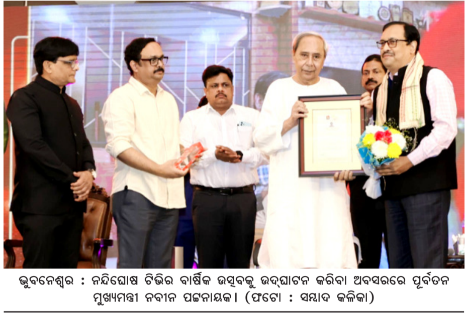
ଭୁବନେଶ୍ୱର : ନବିଘୋଷ ଟିଭିର ବାର୍ଷିକ ଉତ୍ସବକୁ ଉଦ୍‌ଘାଟନ କରିବା ଅବସରରେ ପୂର୍ବତନ ମୁଖ୍ୟମନ୍ତ୍ରୀ ନବୀନ ପଟ୍ଟନାୟକ ।