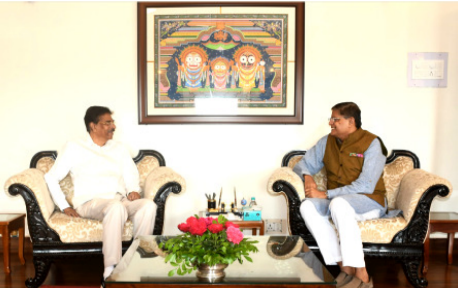
ଭୁବନେଶ୍ୱର : ରାଜଭବନରେ ରାଜ୍ୟପାଳ ଡ. ହରିବାବୁ କମ୍ବୁକମାନଙ୍କୁ ସୌଜନ୍ୟମୂଳକ ସାକ୍ଷାତ କରୁଛନ୍ତି କେନ୍ଦ୍ରାପଡ଼ା ଲୋକସଭା ସଭ୍ୟ ବୈଜୟନ୍ତ ପଣ୍ଡା ।