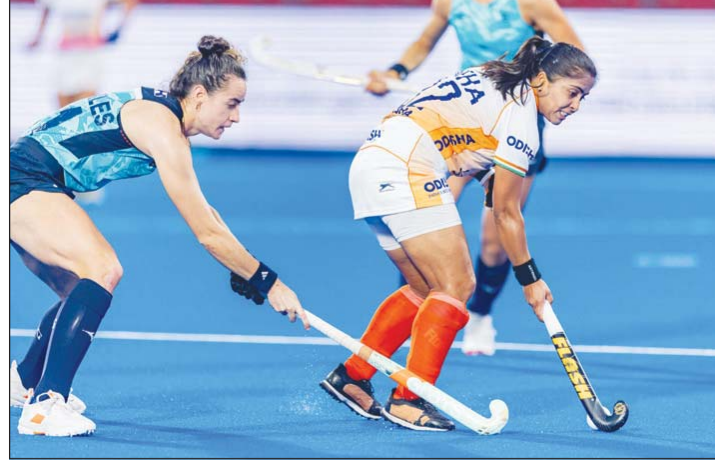
ଭୁବନେଶ୍ୱର : କଳିଙ୍ଗ ଷ୍ଟାଡ଼ିୟମରେ ଅନୁଷ୍ଠିତ ଏଫଆଇଏଏଚ୍ ହକି ପ୍ରୋ ଲିଗ୍‌ର ଦ୍ୱିତୀୟ ଦିବସର ଦ୍ୱିତୀୟ ମ୍ୟାଚ୍‌ରେ ଇଂଲଣ୍ଡ ଠାରୁ ୩-୨ ଗୋଲରେ ହାରିଲା ଦଳ ।