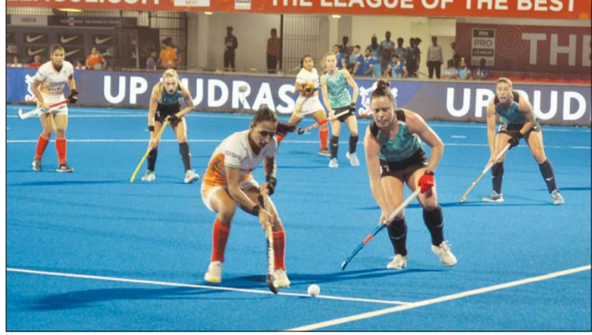
ଭୁବନେଶ୍ୱର : କଳିଙ୍ଗ ଷ୍ଟାଡ଼ିୟମରେ ଅନୁଷ୍ଠିତ ଏଫଆଇଏଏଚ୍ ହକି ପ୍ରୋ ଲିଗ୍‌ର ଦ୍ୱିତୀୟ ଦିବସର ପ୍ରଥମ ମ୍ୟାଚ୍‌ରେ ଜର୍ମାନୀକୁ ୨-୧ ଗୋଲରେ ପରାସ୍ତ କଲା ସ୍ପେନ୍ ମହିଳା ଦଳ ।