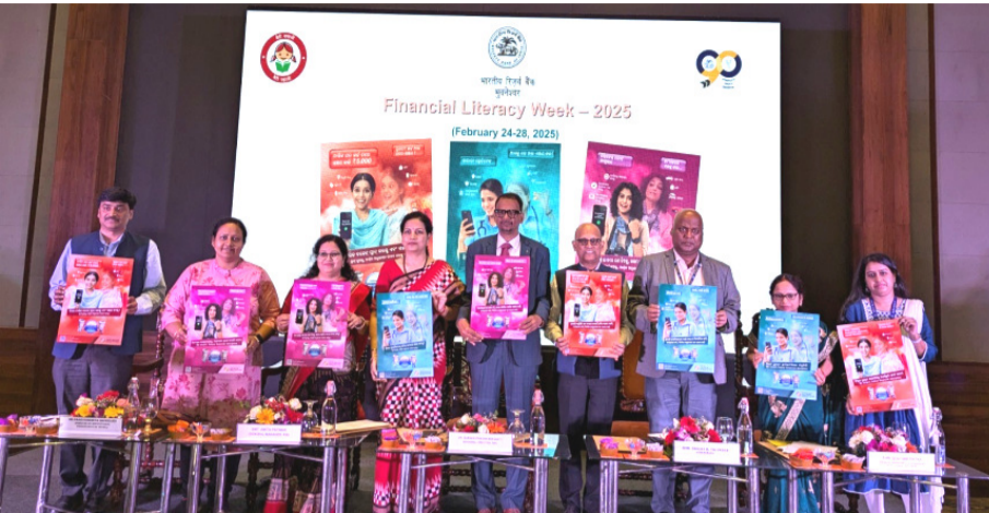
ଭବନେଶ୍ୱରରେ ଆର୍ଥିକ ସାକ୍ଷରତା ସପ୍ତାହ ୨୦୨୫ ଦିନ ଅନୁଷ୍ଠିତ ହୋଇଯାଇଛି । ଏହି ସମ୍ବନ୍ଧରେ ଆରବିଆଇ ଭୁବନେଶ୍ୱରର କର୍ମଚାରୀଙ୍କୁ ଆର୍ଥିକ ସାକ୍ଷରତା ପ୍ରଦାନ କରାଯାଇଛି । ଏହି ଅଭିଯାନରେ ଗୃହିଣୀ, କର୍ମଚାରୀ ମହିଳା ଏବଂ ମହିଳା ଉଦ୍ୟୋଗୀଙ୍କ ଉପରେ ବିଶେଷ ଧ୍ୟାନ ଦେଇ ଆର୍ଥିକ ସାକ୍ଷରତା ପ୍ରଦାନ କରାଯାଇଛି । ଏହି ଅଭିଯାନରେ ଗୃହିଣୀ, କର୍ମଚାରୀ ମହିଳା ଏବଂ ମହିଳା ଉଦ୍ୟୋଗୀଙ୍କ ଉପରେ ବିଶେଷ ଧ୍ୟାନ ଦେଇ ଆର୍ଥିକ ସାକ୍ଷରତା ପ୍ରଦାନ କରାଯାଇଛି ।

ଭୁବନେଶ୍ୱର, ନ୍ୟୁଜ୍ ବ୍ୟୁରୋ ଭାରତୀୟ ରିଜର୍ଭ ବ୍ୟାଙ୍କ ୨୦୧୬ ମସିହାରୁ ପ୍ରତିବର୍ଷ ଏକ ନିର୍ଦ୍ଦିଷ୍ଟ ବିଷୟବସ୍ତୁ ଉପରେ ଆର୍ଥିକ ସାକ୍ଷରତା ସପ୍ତାହ (ଏଫଏଲଡବ୍ଲ୍ୟୁ) ପାଳନ କରିଆସୁଛି । ଚଳିତ ବର୍ଷ ଆର୍ଥିକ ସାକ୍ଷରତା ସପ୍ତାହ ଫେବୃଆରୀ ୨୪ରୁ ୨୮ ତାରିଖ ପର୍ଯ୍ୟନ୍ତ ପାଳନ କରାଯାଉଛି ଯାହାକି ଏହି ଅଭିଯାନର ଦଶମ ସଂସ୍କରଣ ଥାଏ । ଆର୍ଥିକ ଅଭିଭାବନାରେ ମହିଳାମାନଙ୍କର ସ୍ୱାଧିକାରକୁ ଉନ୍ନତ କରିବାକୁ ନେଇ ଏଫଏଲଡବ୍ଲ୍ୟୁ ୨୦୨୫ ର ବିଷୟବସ୍ତୁ ଆର୍ଥିକ ସ୍ୱାଧିକାର ଯାହାକି, ସେ ସମ୍ପୂର୍ଣ୍ଣ ନାରୀ ରଖାଯାଇଛି । ଏହି ଅଭିଯାନରେ ଗୃହିଣୀ, କର୍ମଚାରୀ ମହିଳା ଏବଂ ମହିଳା ଉଦ୍ୟୋଗୀଙ୍କ ଉପରେ ବିଶେଷ ଧ୍ୟାନ ଦେଇ ଆର୍ଥିକ ଯୋଜନା ସମ୍ପର୍କରେ ଆର୍ଥିକ ସାକ୍ଷରତା ପ୍ରଦାନ କରାଯାଇଛି । ଏହି ଅଭିଯାନରେ ଗୃହିଣୀ, କର୍ମଚାରୀ ମହିଳା ଏବଂ ମହିଳା ଉଦ୍ୟୋଗୀଙ୍କ ଉପରେ ବିଶେଷ ଧ୍ୟାନ ଦେଇ ଆର୍ଥିକ ଯୋଜନା ସମ୍ପର୍କରେ ଆର୍ଥିକ ସାକ୍ଷରତା ପ୍ରଦାନ କରାଯାଇଛି । ଏହି ଅଭିଯାନରେ ଗୃହିଣୀ, କର୍ମଚାରୀ ମହିଳା ଏବଂ ମହିଳା ଉଦ୍ୟୋଗୀଙ୍କ ଉପରେ ବିଶେଷ ଧ୍ୟାନ ଦେଇ ଆର୍ଥିକ ଯୋଜନା ସମ୍ପର୍କରେ ଆର୍ଥିକ ସାକ୍ଷରତା ପ୍ରଦାନ କରାଯାଇଛି ।