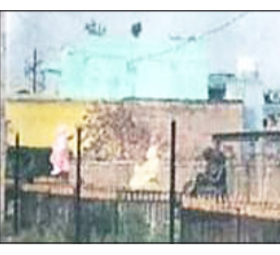
କରାଯାଇଥିଲା । ସେଠାରେ ମହାପୁରୁଷମାନଙ୍କ ପ୍ରତିମୂର୍ତ୍ତି ପ୍ରତିଷ୍ଠା କରାଯାଇଥିଲା । ପାର୍ଟିର ମୁଖ୍ୟ ଫାଟକ ସମ୍ମୁଖରେ କବି ସମ୍ରାଟ ଉପେନ୍ଦ୍ର ଭଞ୍ଜଙ୍କ ବିରାଟକାୟ ପ୍ରତିମୂର୍ତ୍ତି ସ୍ଥାପନ କରାଯାଇଥିବା ବେଳେ ପାର୍ଟି ମଧ୍ୟରେ ଅନ୍ୟ ୪ଟି ପ୍ରତିମୂର୍ତ୍ତି ସ୍ଥାପନ କରାଯାଇଥିଲା ।

ଭୁବନେଶ୍ୱର, ନ୍ୟୁଜ୍ ବ୍ୟୁରୋ ଓଡ଼ିଆ ଅସ୍ମିତା, ସଂସ୍କୃତି ଓ ମହାପୁରୁଷଙ୍କ ସମ୍ମାନ ପ୍ରଦର୍ଶନରେ ବିଜ୍ଞାନପୁରୀର ଅବକାରୀ ପଦାବଳି ପଡ଼ିଛି । ସେଠାରେ ଥିବା ପୋଖରୀ ବନ୍ଧରେ ବିଜ୍ଞାନପୁରୀ ପକ୍ଷରୁ ଏକ ପାର୍ଟି ନିର୍ମାଣ କରାଯାଇଥିଲା । ନିକଟରେ ଶୁଣାଣ ଓ ପୋଖରୀ ଥିବା ଯୋଗୁଁ ଉଚ୍ଚ ପୋଖରୀ ବନ୍ଧରେ ଲୋକେ ନିତ୍ୟକର୍ମ କରି ପରିବେଶ ନଷ୍ଟ କରୁଥିଲେ । ଏହାକୁ ଦୃଷ୍ଟିରେ ରଖି ନିଗମ ପକ୍ଷରୁ ଉଚ୍ଚ ପୋଖରୀ ବନ୍ଧରେ ପାର୍ଟି ନିର୍ମାଣ କରାଯାଇଥିଲା ।