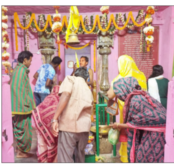
ବାଲିଗୁଡ଼ା, ନ୍ୟୁଜ୍ ବ୍ୟୁରୋ ପବିତ୍ର ମହାଶିବରାତ୍ରୀ ଓ ଜାଗର ଉତ୍ସବ ଅବସରରେ ଗାଁଠୁ ସହରର ସମସ୍ତ ଶୈବ ପୀଠ ଚଳଚଞ୍ଚଳ ହୋଇଉଠିଥିଲା । ବାଲିଗୁଡ଼ା ତଥା ଏହାର ଆଖପାଖ ପ୍ରମୁଖ ଶିବମନ୍ଦିର ସମେତ ଅନ୍ୟାନ୍ୟ ମନ୍ଦିରରେ ମଧ୍ୟ

ସମସ୍ତ ପ୍ରକାର ନାତିକାନ୍ତି ସହ ଦିନ ତମାମ ପୂଜା କାର୍ଯ୍ୟକ୍ରମ ଚଳୁ ରହିଥିଲା । କେବଳ ସେତିକି ନୁହେଁ କନ୍ଧମାଳ ଜିଲ୍ଲାକୁ ଆସୁଥିବା ବିଦେଶୀ ଭକ୍ତମାନେ ଶୁଭାର ସହ ଶିବଆରାଧନା କରିଥିବା ଦେଖିବାକୁ ମିଳିଥିଲା । ଆସ୍ତ୍ରା ଓ ବିଶ୍ୱାସର ଶିବରାତ୍ରୀରେ ଉପବାସ କରି ମାନସିକ ରଖିବା ସହ ଉଚ୍ଚାଗର ରହି ଦାସ ଜାଳିଲେ ରୋଗ ବିରାଗରୁ ମୁକ୍ତି ମିଳିବ ଏବଂ ଯାହା ମାନସିକ କରିଥିବ ତାହା ନିଶ୍ଚିତ ପୁରଣ ହେବ ବୋଲି ବର୍ଷେ ଚଳିଛି । ଗାନ୍ଧିରେ ମହାଦାସ ପ୍ରକାଶ ଏବଂ ମାନସିକ ଓ ଉପବାସ ବ୍ରତରେ ଥିବା ଶ୍ରଦ୍ଧାଳୁମାନେ ଜାଗର ଦାସ ଜାଳିବା ପାଇଁ ପୂଜା କର୍ମିତ ପକ୍ଷରୁ ସମସ୍ତ ବ୍ୟବସ୍ଥା କରାଯାଇଥିଲା । ସନ୍ଧ୍ୟାରେ ବିଭିନ୍ନ ମନ୍ଦିରରେ ଭଜନ କାର୍ତ୍ତବ୍ୟ ସହ ବିଭିନ୍ନ ପ୍ରକାର ସଂସ୍କୃତିକ କାର୍ଯ୍ୟକ୍ରମ ଆୟୋଜନ ହୋଇଥିଲା । ତେବେ ଭକ୍ତଙ୍କ ପ୍ରକଳ ଭିତରୁ ଦୃଷ୍ଟିରେ ରଖି ପରିଚଳନା କର୍ମିତ ଓ ପୋଲିସ ବିଭାଗ ପକ୍ଷରୁ ମଧ୍ୟ ଶୁଖିଳିତ ଦର୍ଶନ ପାଇଁ ସୁତରାଂ ବ୍ୟାପକ ବ୍ୟବସ୍ଥା କରାଯାଇଥିଲା ।