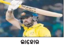
ଲାହୋର ଆଫଗାନିଷ୍ଟାନ ବିପକ୍ଷ ମ୍ୟାଚ୍‌ରେ ଆହତ ହୋଇଥିବା ଅଷ୍ଟ୍ରେଲିଆର ଓପେନିଂ ମାଧୁ୍ୟ ସର୍ତ୍ତ ଭାରତ କ୍ରମା ନ୍ୟୁଜିଲାଣ୍ଡ ବିପକ୍ଷ ଚାମ୍ପିୟନ୍ସ ଟ୍ରଫି ସେମିଫାଇନାଲରୁ ବାଦ୍ ପଡ଼ିପାରିବି। ବର୍ଷା ଯୋଗୁ ବାତିଲ ହୋଇଥିବା ମ୍ୟାଚ୍‌ରେ ସର୍ତ୍ତ ୧୫ ବଲ୍‌ରେ ୨୦ ରନ କରିଥିଲେ। ତାଙ୍କୁ ଆମ୍‌ପାଉଣ୍ଟ୍ ରମରକାଲ ଆଉଟ୍ କରିଥିଲେ। ଅଷ୍ଟ୍ରେଲିଆ ଅଧିନାୟକ ଷ୍ଟିଭ୍ ବ୍ଲିଅ ଅଷ୍ଟ୍ରେଲିଆନ୍ ଆସୋସିଏସନ ତେପୁସ୍କୁ କହିଛନ୍ତି, 'ମୁଁ ଭାବୁଛି ସେ ସମ୍ପୂର୍ଣ୍ଣ ଫିଟ୍ ନୁହେଁ।' ସେ ଠିକ୍ ଭାବରେ ଚାଲିପାରୁ ନାହିଁ। ଓପେନିଂ ମ୍ୟାଚ୍‌ରେ ତାଙ୍କର ସୁସ୍ଥ ହେବା କଞ୍ଚକର ହେବ।