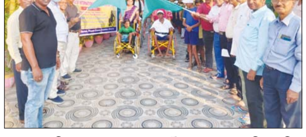
ଉପକ୍ରମ୍ କରି ଏହାର ଉଦ୍‌ଘାଟନରେ ସଫଳତା ଅର୍ଜନ କରି କେବଳ ନିଜର ନାମକୁ ଅମର କରିଯାଇ ନାହିଁ, ବରଂ ସବୁଦିନକୁ ଶାନ୍ତିରାଜ ଅବୟବ ଅଟକ କିମ୍ପା ତଳାଢ଼ିବା କରିପାରୁଥିବା ଲୋକଙ୍କୁ ଆବନକୁ ସହଜ ସରଳ କରିବା ପାଇଁ ଏକ ସୁଯୋଗ ଦେଇ ଯାଇଛନ୍ତି। ପ୍ରସ୍ତୁତିଦିବ୍ୟା, ଯାତ୍ରିକ ଜ୍ଞାନ