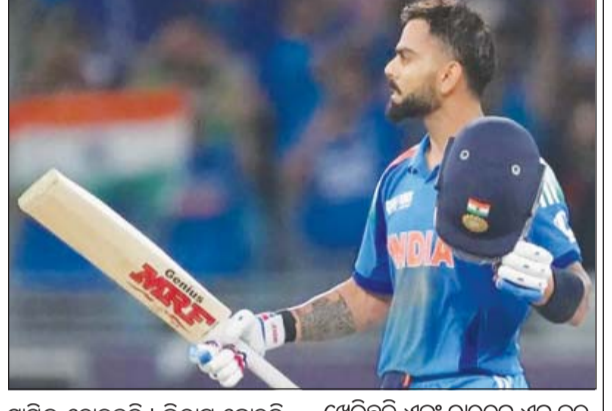
ଆମିଲ ହୋଇଛନ୍ତି। ବିରାଟ କୋହଲି ଏକଦିବସୀୟ କ୍ୟାରିୟରରେ ଏପର୍ଯ୍ୟନ୍ତ ଅନେକ ଏିତି ହାସିଲ କରିଛନ୍ତି।

ଦୁବାଇ ଚାମ୍ପିୟନ୍ସ ଟ୍ରଫି ୨୦୨୫ର ଗୁପ୍ 'ଏ' ଶ୍ରେଣି ମ୍ୟାଚ୍‌ରେ ଦୁବାଇ ଅନ୍ତର୍ଜାତୀୟ କ୍ରିକେଟ ଷ୍ଟାଡିୟମରେ ଭାରତ ଏବଂ ନ୍ୟୁଜିଲାଣ୍ଡ ମଧ୍ୟରେ ଖେଳାଯାଇଥିଲା। ଏହି ମ୍ୟାଚ୍‌ରେ ବିରାଟ କୋହଲି ତାଙ୍କର ୩୦୦ତମ ଏକଦିବସୀୟ ମ୍ୟାଚ୍ ଖେଳିଛନ୍ତି। ଏହା ସହିତ ସେ ୩୦୦ ଦିନିକିଆ କୁର୍ରେ ଯୋଗଦେଇଛନ୍ତି। ତାଙ୍କ ପୂର୍ବରୁ କେବଳ ସଚିନ ଡେବୁଲକର, ଏମ୍‌ଏସ୍ ଥୋଡି, ମହମ୍ମଦ ଆସଫୁଦ୍ଦିନ, ରାହୁଲ ଘାଟକ, ସୌରଭ ଗାଙ୍ଗୁଲି ଏବଂ ସୁବରାଜ ସିଂହ ଏହି ସଫଳତା ହାସଲ କରିପାରିଥିଲେ। ଏପର୍ଯ୍ୟନ୍ତ, ବିରାଟ ତାଙ୍କ ଏକଦିବସୀୟ କ୍ୟାରିୟରରେ ୨୯୯ଟି ମ୍ୟାଚ୍ ଖେଳିଛନ୍ତି ଏବଂ ୫୮୨୦ର ପ୍ରଭାବଶାଳୀ ହାରରେ ୧୪,୦୮୫ ରନ କରିଛନ୍ତି। ଏହି ରେକର୍ଡ ସହିତ, କୋହଲି ଭାରତୀୟ କ୍ରିକେଟରେ ୧୦୦ ଟେଷ୍ଟ, ୧୦୦ ଟି-୨୦ ଏବଂ ୩୦୦ ଦିନିକିଆ ଖେଳିଥିବା କିଛି ବନ୍ଧା ବନ୍ଧା ଖେଳାଳିଙ୍କ ଗୋଷ୍ଠୀରେ