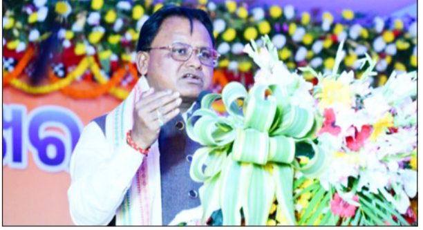
ଚନ୍ଦ୍ରଶେଖର ମହାବିଦ୍ୟାଳୟର ୪୮ତମ ବାର୍ଷିକୋତ୍ସବ