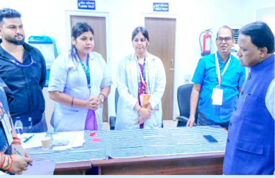
ଭୁବନେଶ୍ୱର : ଅଭିଯୋଗ ପ୍ରକାଶରେ ମୁଖ୍ୟମନ୍ତ୍ରୀ ମୋହନ ଚରଣ ମାଝୀ ବିଭିନ୍ନ ବର୍ଗର ଜନତାଙ୍କ ସମସ୍ୟା ସମ୍ବନ୍ଧରେ ଅଭିଯୋଗର ଶୁଣାଣି କରୁଛନ୍ତି ।