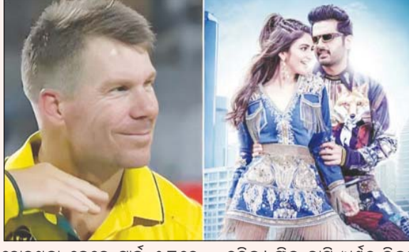
ହୋଇଥିବା ବେଳେ ମାର୍ଚ୍ଚ ୨୮ରେ ରିଲିଜ୍ ହେବ । ଏହାର ଗୋଟିଏ କିମ୍ବା ଦୁଇ ଦିନ ପରେ ସମ୍ପାଦନ ଖାତାକୁ 'ସିକନ୍‌ହୁଡ଼' ମଧ୍ୟ ସିନେମାରେ ରିଲିଜ୍ ହେବ ।