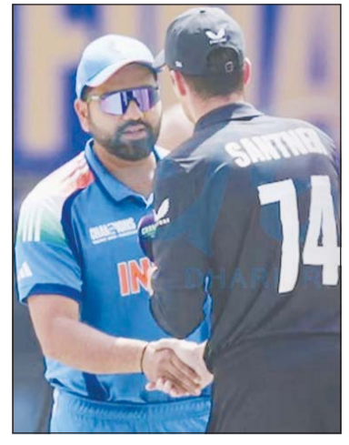
ନିଷ୍ଠିଳ ନେଇଥିଲେ । ଏହା ସହିତ ଭାରତୀୟ ଅଧିନାୟକ ରୋହିତ ଶର୍ମା ଏକଦିବସୀୟ କ୍ରିକେଟରେ ସର୍ବାଧିକ ଲଗାତାର ଚମ୍ପିୟା ହାରିବାର

ଦୁବାଇ ଚାମ୍ପିୟନ୍ ଟ୍ରଫି ଫାଇନାଲ ମୁକାବିଲାରେ ଖିଲିଥିଲେ ଟିମ୍ ଇଣ୍ଡିଆ-ନ୍ୟୁଜିଲାଣ୍ଡ । ଦୁବାଇ ଅନ୍ତର୍ଜାତୀୟ ଷ୍ଟାଡିୟମରେ ରବିବାର ଖେଳାଯାଇଥିବା ଏହି ଗୁରୁତ୍ୱପୂର୍ଣ୍ଣ ମ୍ୟାଚରେ ଚମ୍ପିୟା ହାରି ଭାରତୀୟ ଅଧିନାୟକ ରୋହିତ ଶର୍ମା ବିଶ୍ୱରେକର୍ଡ କରିଥିଲେ । ଦିନିକିଆରେ ଲଗାତାର ଭାବେ ଦଳ ୧୫୦ମ ଚମ୍ପିୟା ହାରିଥିବା ବେଳେ ରୋହିତ ୧୨୦ମ ଚମ୍ପିୟା ହାରିଥିଲେ । ସେ ଏହି ମ୍ୟାଚରେ ବ୍ରାଏନ୍ ଲାରାଙ୍କ ରେକର୍ଡର ସମକକ୍ଷ ହୋଇଛନ୍ତି । ଫାଇନାଲର ମ୍ୟାଚ ଫଳାଫଳ ପୂର୍ବରୁ ଚମ୍ପିୟା ହେବେ ସମକକ୍ଷ ନକର ଥିଲା । କିନ୍ତୁ ଏଥର ମଧ୍ୟ ସମାନ ଘଟଣା ଘଟିଥିଲା । ରୋହିତ ପୁଣିଥରେ ଚମ୍ପିୟା ହେଲେ ସଫଳତା ନ୍ୟୁଜିଲାଣ୍ଡ ଅଧିନାୟକ ମିଚେଲ ସାଣ୍ଟନରଙ୍କୁ ମିଳିଥିଲା । ଏହି ଫାଇନାଲରେ ସାଣ୍ଟନର ଚମ୍ପିୟା ହେବା ପ୍ରଥମେ ବ୍ୟାଟିଂ କରିବାକୁ