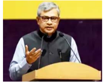
ନାମରୂପ୦ରେ ବହୁପ୍ରତି ଭାଗି ଫର୍ଟିଲାଇଜର କର୍ପୋରେସନ ଲିମିଟେଡର ବର୍ତ୍ତମାନର ପରିସରରେ ଏକ ନୂତନ ହାଉସିଂକୁ ଆନୋନିଆ-ୟୁପିଆ କମ୍ପ୍ଲେକ୍ସ ନାମରୂପ-୪ ସାର କାରଖାନା ସ୍ଥାପନ କରିବାକୁ ସରକାର ନିଷ୍ପତ୍ତି ନେଇଛନ୍ତି । ଏହି ପ୍ରକଳ୍ପ ଦେଶରେ ଅନୁମୋଦନ କରିଛନ୍ତି । ଏହି ଯୋଜନା ଦ୍ୱାରା ଉତ୍ପାଦନ ଏବଂ ଉତ୍ପାଦକତାକୁ ଯଥେଷ୍ଟ ବୃଦ୍ଧି କରିବ ଏବଂ ଏହା ଦ୍ୱାରା କୃଷକଙ୍କ ଆୟ ବୃଦ୍ଧି ପାଇବ ବୋଲି ସେ କହିଛନ୍ତି ।

ନୂଆଦିଲ୍ଲୀ, ୧୯ ମାର୍ଚ୍ଚ କମ୍ ମୂଲ୍ୟର ଭୀମ-ୟୁପିଆଇ କାରବାରକୁ ପ୍ରୋତ୍ସାହନ ଦେବା ପାଇଁ କେନ୍ଦ୍ର ସରକାର ରୁଧିବାର ଏକ ପ୍ରୋତ୍ସାହନ ଭିତିକ ଯୋଜନାକୁ ଅନୁମୋଦନ କରିଛନ୍ତି । ଏକ ହଜାର ୫୦୦ କୋଟି ଟଙ୍କା ବ୍ୟୟ ଅଟକଳରେ ଏହି ଯୋଜନା କାର୍ଯ୍ୟକାରୀ ହେବ । କ୍ୟାବିନେଟ ନିଷ୍ପତ୍ତି ସମ୍ପର୍କରେ ରୁଧିବାର ନୂଆଦିଲ୍ଲୀରେ ଗଣମାଧ୍ୟମକୁ ସୂଚନା ଦେଇ ସୂଚନା ଓ ପ୍ରସାରଣ ମନ୍ତ୍ରୀ ଅଶ୍ୱିନୀ ଦେବି କହିଛନ୍ତି ଯେ ଏହି ଯୋଜନା ଦ୍ୱାରା କ୍ଷୁଦ୍ର ବ୍ୟବସାୟୀମାନେ ବିନା ଅତିରିକ୍ତ ସ୍ଥଳ ବ୍ୟବସାୟୀମାନଙ୍କୁ ଦୁଇ ହଜାର ଟଙ୍କା ପର୍ଯ୍ୟନ୍ତ କାରବାର ପାଇଁ ପ୍ରତି ଦେଶନେଶୀ ମୂଲ୍ୟ ୦.୧୫ ପ୍ରତିଶତ ହାରରେ ପ୍ରୋତ୍ସାହନ ରାଶି ପ୍ରଦାନ କରାଯିବ ବୋଲି ସେ କହିଛନ୍ତି । ଶ୍ରୀ ଦେବି କହିଛନ୍ତି ଯେ, ଆସାମର