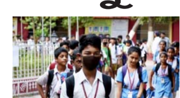
କାର୍ତ୍ତ ହେବନାହିଁ ବୋଲି ମନ୍ତ୍ରୀ ସୂଚନା ଦେଇଛନ୍ତି । ମୁଖ୍ୟମନ୍ତ୍ରୀ ମୋହନ ଚରଣ ମାଝୀଙ୍କ ନିଦେଶକ୍ରମେ ପ୍ରବଳ ଗ୍ରୀଷ୍ମ ପ୍ରବାହକୁ ଦୃଷ୍ଟିରେ ରଖି ରାଜ୍ୟର ସମସ୍ତ ଅଜନବାଡ଼ି କେନ୍ଦ୍ରଗୁଡ଼ିକୁ ସକାଳୁ ୯ ଟା ରୁ ୧୧ ଟା ଯାଏଁ କରିବା ପାଇଁ ମହିଳା ଓ ଶିଶୁ ବିକାଶ (ପୃଷ୍ଠା ୭ରେ)

ଭୁବନେଶ୍ୱର, ୧୯ ମାର୍ଚ୍ଚ ନୂଆଲୁଗା ଆସନ୍ତା ଏପ୍ରିଲ ୨ ତାରିଖରୁ ରାଜ୍ୟରେ ସମସ୍ତ ସ୍କୁଲ ସକାଳୁଆ ହେବ । ଗ୍ରୀଷ୍ମ ପ୍ରବାହକୁ ଦୃଷ୍ଟିରେ ରଖି ରାଜ୍ୟ ସରକାରଙ୍କ ପକ୍ଷରୁ ଏହି ନିଷ୍ପତ୍ତି ନିଆଯାଇଛି ବୋଲି ରାଜସ୍ୱ ଓ ବିପର୍ଯ୍ୟୟ ପରିଚଳନା ମନ୍ତ୍ରୀ ସୁରେଶ ପୂଜାରୀ ପ୍ରକାଶ କରିଛନ୍ତି । ମନ୍ତ୍ରୀ ଆହୁରି କହିଛନ୍ତି, ଅଜନବାଡ଼ି କେନ୍ଦ୍ରଗୁଡ଼ିକ ସକାଳୁ ୯ଟା ପର୍ଯ୍ୟନ୍ତ ଚଳିବ । ଏହା ବ୍ୟତୀତ ଦିନ ୧୧ଟାରୁ ଅପରାହ୍ଣ ୩ଟା ପର୍ଯ୍ୟନ୍ତ ଶୁଣି କିଛି କାମ କରାଇବାକୁ ବାରଣ କରାଯାଇଛି । ଏଥି ସହ ଅପେକ୍ଷିତ ବିଦ୍ୟୁତ୍