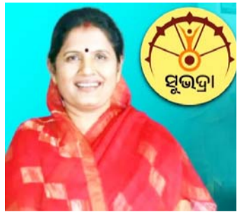
ପୁଣି ସୁଭଦ୍ରାକୁ ନେଇ ବଡ଼ ଘୋଷଣା କରିଛନ୍ତି ଉପମୁଖ୍ୟମନ୍ତ୍ରୀ ପ୍ରଭାତୀ ପରିଡା । ସେ କହିଛନ୍ତି ରାସନ କାର୍ଡ ଏବଂ ଆୟରେ

ତାଳମେଳ ଅଭାବରୁ ୧ ଲକ୍ଷ ମହିଳା ସୁଭଦ୍ରା ଟଙ୍କା ପାଇବାକୁ ବଞ୍ଚିତ ହୋଇଛନ୍ତି । ପ୍ରଥମ କିଷ୍ତି ପାଇଛନ୍ତି ମାତ୍ର ଆୟ ବୃଦ୍ଧି ଦର୍ଶାଇ ରାସନ କାର୍ଡ ଫେରାଇଛନ୍ତି । କିଏ ଗାଡ଼ି କିଣିଛନ୍ତି ଏବଂ କିଏ ୫ ଏକର ଜମି ନ ଥାଇ ଅଧିକ ଧାନ ମଣ୍ଡିରେ ଦେଇଛନ୍ତି । ଏ ନେଇ ମାର୍ଚ୍ଚ ୩୧ ପରେ ଖାନ ଟୁ ଖାନ ସର୍ତ୍ତ କରାଯିବ । ରାଷ୍ଟ୍ରୀୟ ପୂର୍ଣ୍ଣମାନେ ବଞ୍ଚିତ ଥିବା ଯୋଗ୍ୟ ହିତାଧିକାରୀ ମାନେ ଦ୍ୱିତୀୟ କିଷ୍ତି ସୁଭଦ୍ରା ଟଙ୍କା ପାଇବେ । ମାର୍ଚ୍ଚ ୩୧ ପର୍ଯ୍ୟନ୍ତ ଯେଉଁମାନଙ୍କୁ ବୟସ ୨୧ ହେଉଥିବ, ସେମାନେ ସୁଭଦ୍ରା ଯୋଜନା ପାଇଁ ଆବେଦନ କରି ପାରିବେ ବୋଲି ଉପମୁଖ୍ୟମନ୍ତ୍ରୀ କହିଥିଲେ ।