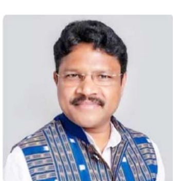
ଲକ୍ଷ ୪୩୮ ହଜାର ଟଙ୍କାର ଖର୍ଚ୍ଚ ଦାବି ଆଗତ କରିଥିଲେ । ଖର୍ଚ୍ଚ ଦାବି ଆଲୋଚନା ଉତ୍ତର ଦେଇ ମନ୍ତ୍ରୀ କହିଥିଲେ ଯେ, ରାଜ୍ୟରେ ସ୍ୱାସ୍ଥ୍ୟ ଭିତ୍ତିକୁ ସୁଦୃଢ଼ କରିବା ସହିତ ଲୋକମାନଙ୍କୁ