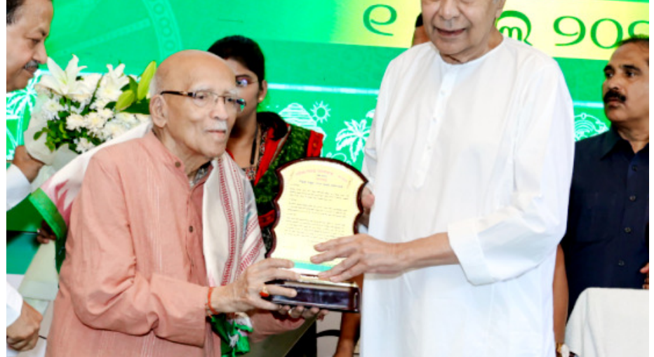
ଭୁବନେଶ୍ୱର : ଶଙ୍ଖ ଭବନରେ ପବିତ୍ର ଓଡ଼ିଶା ଦିବସ ସମାରୋହ ପାଳନ ଅବସରରେ ବିଶିଷ୍ଟ ଭାଷାବିତ୍ ପଦ୍ମଶ୍ରୀ ଡକ୍ଟର ଦେବୀ ପ୍ରସନ୍ନ ପଟ୍ଟନାୟକଙ୍କୁ ସମ୍ବର୍ଦ୍ଧିତ କରୁଛନ୍ତି ପୂର୍ବତନ ମୁଖ୍ୟମନ୍ତ୍ରୀ ନବୀନ ପଟ୍ଟନାୟକ ।