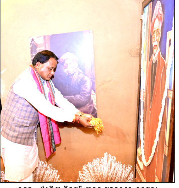
କଟକ : “ଓଡ଼ିଶା ଦିବସ” ପାଳନ ଅବସରରେ କନ୍ଦୁସୁଳା ସତ୍ୟଭାମାପୁରରେ ମଧୁବାବୁଙ୍କ ଫଟୋ ଚିତ୍ରରେ ଶ୍ରଦ୍ଧାଞ୍ଜଳି ଅର୍ପଣ କରୁଛନ୍ତି ମୁଖ୍ୟମନ୍ତ୍ରୀ ମୋହନ ଚରଣ ମାଝୀ ।

RNI Regd. No. : 52640/94 Postal Regd. No. : BN/60/25-27