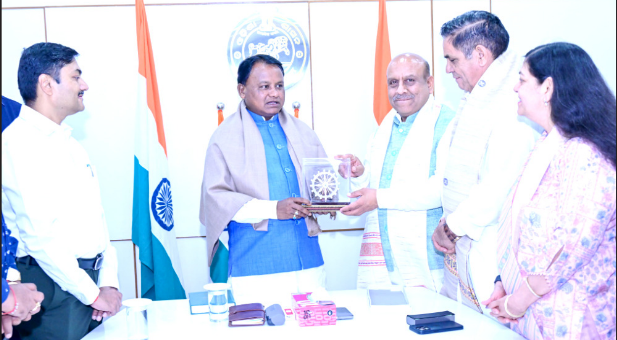
ଭୁବନେଶ୍ୱର : ଲୋକସେବା ଜବନ ଠାରେ ମୁଖ୍ୟମନ୍ତ୍ରୀ ମୋହନ ଚରଣ ମାଝୀଙ୍କୁ ଦିଲ୍ଲୀ ବିଧାନସଭାର ବାଟସ୍ଥତି ବିଜେନ୍ଦ୍ର ଗୁପ୍ତା ଏବଂ ଉପବାଟସ୍ଥତି ମୋହନ ସିଂ ବିଷ୍ଣୁ ସୌଜନ୍ୟ ମୂଳକ ସାକ୍ଷାତ କରୁଛନ୍ତି ।

ଏହି ପାଳି ଯାତ୍ରା ଆରମ୍ଭ ହୋଇ ବୈଶାଖ ମାସ ପ୍ରଥମ ମଙ୍ଗଳବାରରେ ପଞ୍ଚମ ପାଳିରେ ମା’ ମଙ୍ଗଳାଙ୍କ ପ୍ରସିଦ୍ଧ ଝାମୁଯାତ୍ରାରେ ସମାପନ ହୋଇଥିଲା । ଶେଷ ମଙ୍ଗଳବାରରେ ବ୍ରତଧାରୀ ମହିଳାମାନେ ପରିବାର ମଙ୍ଗଳକାମନା ପାଇଁ ଗାଁ ଦାଣ୍ଡରେ ପହଞ୍ଚି ନିର୍ମାଣ କରି ଗୁଆ, ନଡ଼ିଆ, କଦଳୀ, ଖଇ ସହ ପଣା ହଳଦୀ ପାଣି ଦେଇ ପୂଜା ସମାପନ କରିଥାନ୍ତି । ମା’ ଶାରଳାଙ୍କ ପାଠରୁ ଆସିଥିବା ଘଣ୍ଟ ପାଠୁଆମାନେ ପ୍ରାଚୀ ନଦୀରୁ ଜଳ ଆଣି ମା’ଙ୍କ ଉଦ୍ଦେଶ୍ୟରେ ଝାମୁ ନିଆଁରେ ଧାସ ଦେଇଥିଲେ । ଶେଷ ପାଳିରେ ମା’ ମଙ୍ଗଳାଙ୍କ ନିକଟରେ ନାହିଁ ନଥିବା ଭିତ ପରିଲକ୍ଷିତ ହୋଇଥିଲା । ପିଲାଙ୍କ ମଙ୍ଗଳ କାମନା କରି ମା’ଙ୍କ ଆଶୀର୍ବାଦ ନେବାକୁ ଧାଇଁ ଆସିଛନ୍ତି ବହୁ ଶ୍ରଦ୍ଧାଳୁ ।