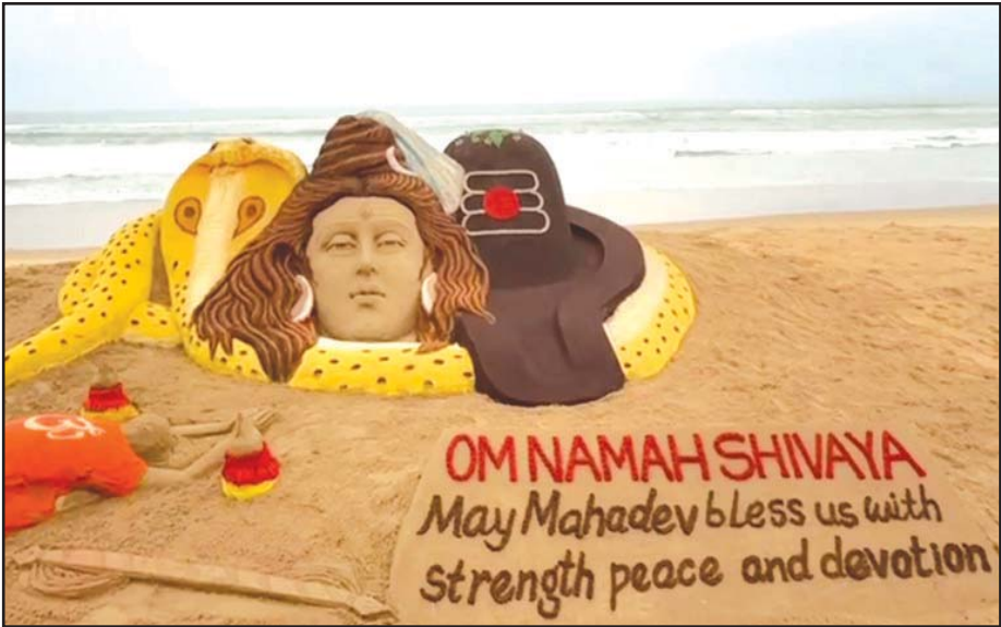
ପୁରୀ : ବେଳାଭୂମିରେ ସୁନ୍ଦର ବାଲୁକା ଚିତ୍ରକଳା କରିଛନ୍ତି ଅନ୍ତର୍ଜାତୀୟ ବାଲୁକା ଚିତ୍ର ଶିଳ୍ପୀ ପଦ୍ମଶ୍ରୀ ସୁଦର୍ଶନ ପଟ୍ଟନାୟକ । ସମସ୍ତ ଶ୍ରଦ୍ଧାଳୁଙ୍କୁ ଶ୍ରାବଣ ପ୍ରଥମ ସୋମବାରର ଶୁଭେଚ୍ଛା ଜଣାଇବା ସହ ପ୍ରଭୁ ମହାଦେବ ସବୁ ଭକ୍ତଙ୍କୁ ଶାନ୍ତି, ସୁଖ ଓ ସମୃଦ୍ଧି ପ୍ରଦାନ କରନ୍ତୁ ବୋଲି ଏହି ବାଲୁକା ଚିତ୍ରକଳାରେ ବାର୍ତ୍ତା ଦେଇଛନ୍ତି ସୁଦର୍ଶନ ପଟ୍ଟନାୟକ ।