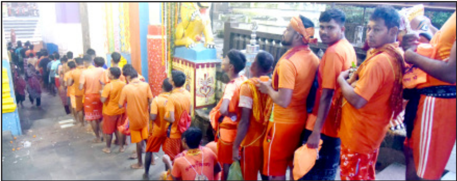
ଭୁବନେଶ୍ୱର : ଶ୍ରାବଣ ପ୍ରଥମ ସୋମବାରରେ ପ୍ରଭୁ ଶ୍ରୀକିଙ୍ଗରାଜଙ୍କ ଠାରେ ଜଳଲାଗି କରିବା ନିମନ୍ତେ ମନ୍ଦିର ସମ୍ମୁଖରେ କାଉଡିଆମାନଙ୍କ ଲମ୍ବା ଧାଡ଼ି ।