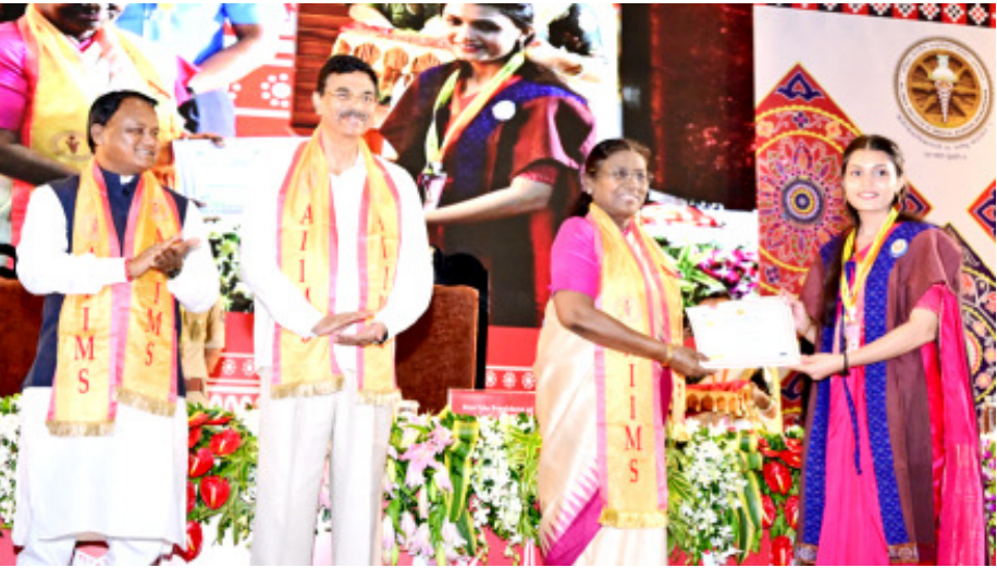
ଭୁବନେଶ୍ୱର : ଏମ୍ ଭୁବନେଶ୍ୱରର ପଞ୍ଚମ ସମାବର୍ତ୍ତନ ଉତ୍ସବରେ ମହାମହିମ ରାଷ୍ଟ୍ରପତି ଶ୍ରୀମତୀ ଦ୍ରୌପଦୀ ମୁର୍ମୁ ଚଳିତ ବର୍ଷ ଡିଗ୍ରୀ ଓ ପଦକ ହାସଲ କରିଥିବା ସ୍ୱାସ୍ଥ୍ୟସେବା ବୃତ୍ତିଗତଧାରୀଙ୍କୁ ସମ୍ମାନିତ କରୁଛନ୍ତି । ନିକଟରେ ଉପସ୍ଥିତ ଅଛନ୍ତି ରାଜ୍ୟପାଳ ଡ. ହରିବାବୁ କମ୍ବମପାଟି ଓ ମୁଖ୍ୟମନ୍ତ୍ରୀ ମୋହନ ଚରଣ ମାଝୀ ।