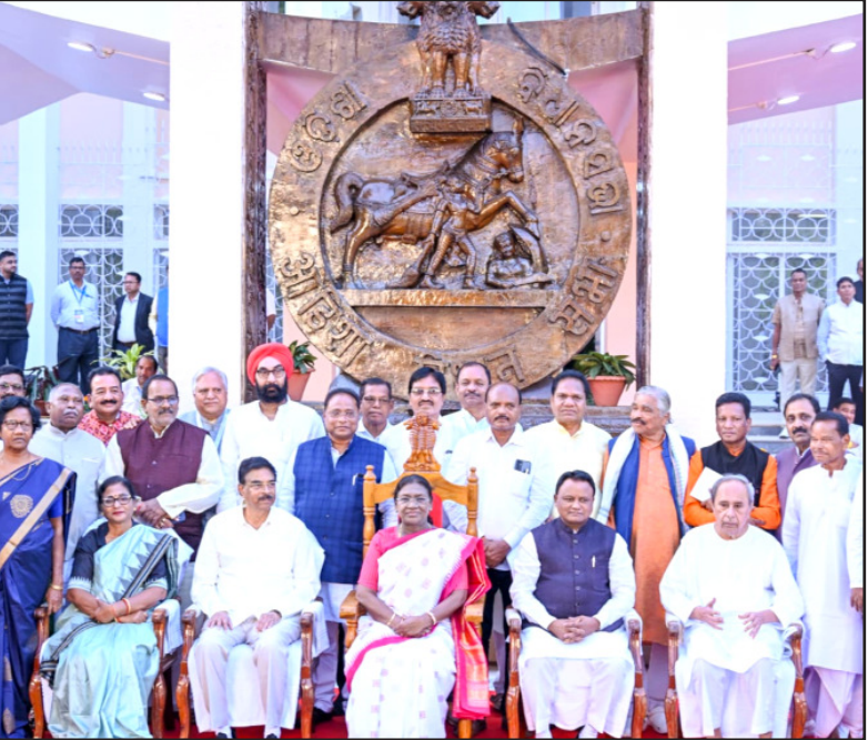
ଭୁବନେଶ୍ୱର : ବିଧାନସଭା ପରିସରରେ ପୂର୍ବତନ ସାଂସଦ ଓ ବିଧାୟକମାନେ ରାଷ୍ଟ୍ରପତି ଶ୍ରୀମତୀ ଡ୍ରୌପଦୀ ମୂର୍ମୁଙ୍କୁ ଶ୍ରେକଳମ୍ବୁଳକ ସାକ୍ଷାତ କରୁଛନ୍ତି ।