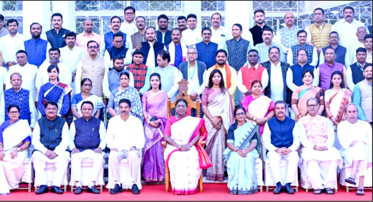
ଭୁବନେଶ୍ୱର : ବିଧାନସଭା ପରିସରରେ ବର୍ତ୍ତମାନର ବାରଷତି, ଉପବାଚସ୍ପତି, ମୁଖ୍ୟମନ୍ତ୍ରୀ, ଉପମୁଖ୍ୟମନ୍ତ୍ରୀ ଓ ବିଧାୟକମାନଙ୍କ ଗହଣରେ ମହାମହିମ ରାଷ୍ଟ୍ରପତି ଶ୍ରୀମତୀ ଡ୍ରୌପଦୀ ମୂର୍ମୁ । (ଫଟୋ : ସମ୍ବାଦ କଳିକା)