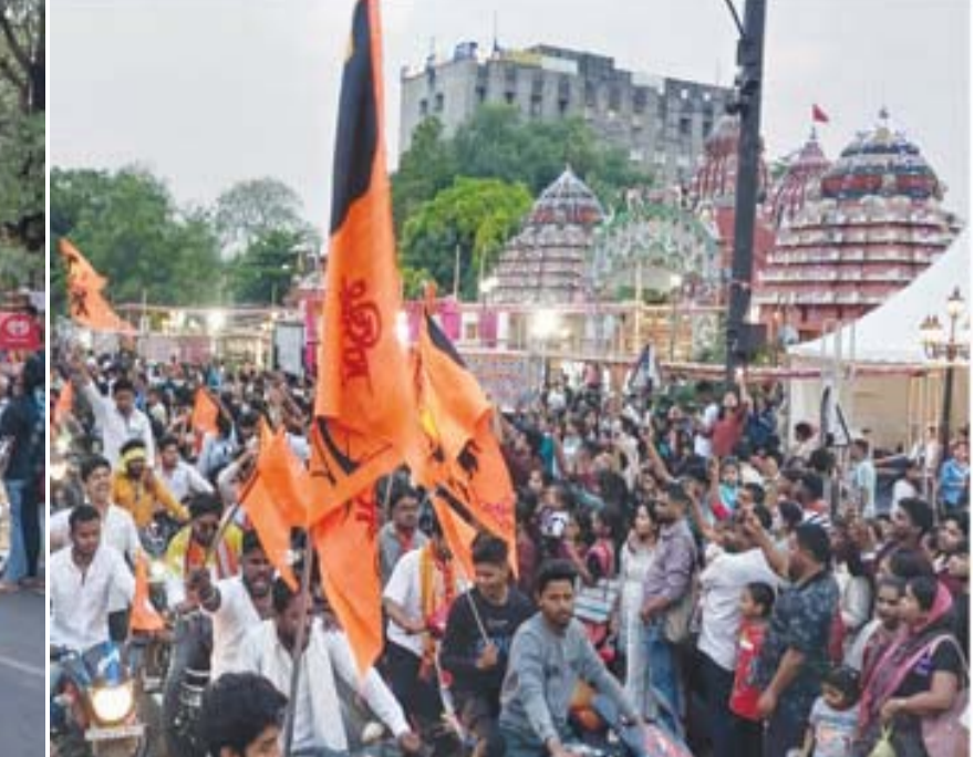
ଭୁବନେଶ୍ୱର : ପବିତ୍ର ଶ୍ରୀରାମ ନବମୀ ଅବସରରେ ରାମ ମନ୍ଦିରରେ ଭକ୍ତମାନେ ଠାକୁରଙ୍କୁ ପୂଜାର୍ଚ୍ଚନା କରିବା ସହ ରାଜଧାନୀରେ ରାମଭକ୍ତମାନଙ୍କ ବିଶାଳ ଶୋଭାଯାତ୍ରା।