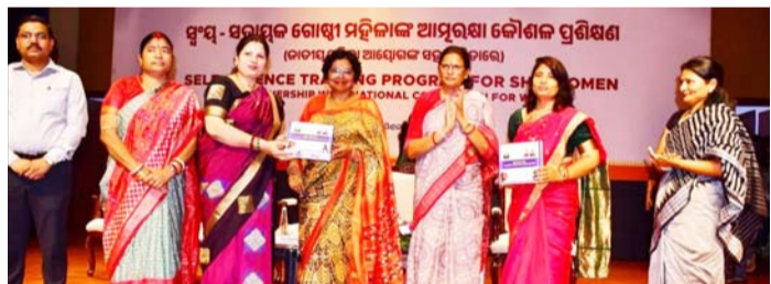
ଅତିଥି ଭାବେ ଯୋଗ ଦେଇଥିଲେ ଏହି ସମାବେଶକୁ ସମ୍ବୋଧିତ କରି ପ୍ରମୁଖ ଲକ୍ଷ୍ୟ ଏହି ପ୍ରଶିକ୍ଷଣ ଦ୍ୱାରା ମହିଳାମାନେ ଆତ୍ମରକ୍ଷା ସହ ସମାଜରେ ବିଚରଣ କରିପାରିବେ ଏବଂ ନିର୍ଭୟରେ ବିଭିନ୍ନ ଆର୍ଥିକ (ପୃଷ୍ଠା ୭ରେ)