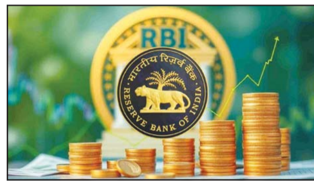
ଶେଷ ହୋଇଥିବା ସମୟ ମଧ୍ୟରେ ଦେଶର ବିଦେଶୀ ମୁଦ୍ରା ଭଣ୍ଡାର ୧୦.୨୮ ବିଲିୟନ ଡଲାର ହ୍ରାସ ପାଇ ୬୮୮.୦୬ ବିଲିୟନ ଡଲାର ହୋଇଛି। ଆରବିଆଲ କହିଛି ଯେ ବିଦେଶୀ ମୁଦ୍ରା ଭଣ୍ଡାରର ଏକ ପ୍ରମୁଖ ଅଂଶ, ବିଦେଶୀ ମୁଦ୍ରା ସମ୍ପତ୍ତି ଏହି ସମୟ ମଧ୍ୟରେ ୧.୭୮ ବିଲିୟନ ଡଲାର ବୃଦ୍ଧି ପାଇ ୫୫୨.୮୫ ବିଲିୟନ ଡଲାର ହୋଇଛି। ସୂଚନା ଅନୁଯାୟୀ, ଏହି

ନୂଆଦିଲ୍ଲୀ/ମୁମ୍ବାଇ, ୧୦।୪ ପଶ୍ଚିମ ଏସୀୟ ସଙ୍କଟ ମଧ୍ୟରେ ଆର୍ଥିକ କ୍ଷେତ୍ରରେ ଏକ ଭଲ ଖବର ଆସିଛି। ଦେଶର ବିଦେଶୀ ମୁଦ୍ରା ଭଣ୍ଡାର ଗା ଏପ୍ରିଲରେ ଶେଷ ହୋଇଥିବା ସପ୍ତାହରେ ୯.୦୬ ବିଲିୟନ ଡଲାର ବୃଦ୍ଧି ପାଇ ୨୯୭.୧୨ ବିଲିୟନ ଡଲାର ହୋଇଛି। ଭାରତୀୟ ରିଜର୍ଭ ବ୍ୟାଙ୍କ ଶୁକ୍ରବାର ଦିନ ତଥ୍ୟ ଜାରି କରି କହିଛି ଯେ ଦେଶର ବିଦେଶୀ ମୁଦ୍ରା ଭଣ୍ଡାର ଗା ଏପ୍ରିଲରେ ଶେଷ ହୋଇଥିବା ସପ୍ତାହରେ ୯.୦୬ ବିଲିୟନ ଡଲାର ବୃଦ୍ଧି ପାଇ ୨୯୭.୧୨ ବିଲିୟନ ଡଲାର ହୋଇଛି। ଏକ ସପ୍ତାହ ପୂର୍ବରୁ, ୨୭ ମାର୍ଚ୍ଚରେ