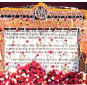
ସମ୍ପର୍କ ବିଭାଗ ପକ୍ଷରୁ ସ୍ଥାନୀୟ ଜୟଦେବ ଭବନ ଠାରେ ଆୟୋଜିତ ଫଟୋଟିଡ଼ି ପ୍ରଦର୍ଶନୀ ସକାଳ ୮

ଭୁବନେଶ୍ୱର, ନ୍ୟୁଜ୍ ବ୍ୟୁରୋ ସୋମବାର ଠାରୁ ୨ ଦିନିଆ ୭୮ତମ ରାଜଧାନୀ ପ୍ରତିଷ୍ଠା ଦିବସ ସମାରୋହ ପାଳନ ଆରମ୍ଭ ହେବାକୁ ଯାଉଛି । ଏହି ଅବସରରେ ସୋମବାର ସକାଳ ସାଢ଼େ ୬ ଘଟିକା ସମୟରେ ଓଡ଼ିଶା ବିଧାନସଭା ସମ୍ମୁଖସ୍ଥ ଶିଳାନ୍ୟାସ ଫଳକରେ ମାଲ୍ୟାପର୍ଣ୍ଣ ସହ ବିଭିନ୍ନ କାର୍ଯ୍ୟକ୍ରମ ଅନୁଷ୍ଠିତ ହେବ । ଏତଦବ୍ୟତୀତ ପୂଜନା ଓ ଲୋକ