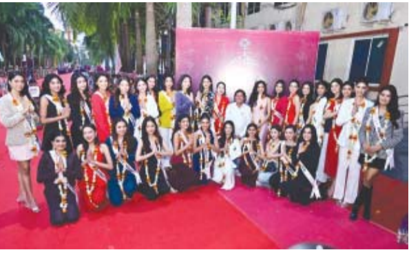
ଫେମିନା ମିସ୍ ଇଣ୍ଡିଆ ପ୍ରତିଯୋଗିତା ପ୍ରସାର ପ୍ରସାର ପାଇଁ ସୁବ୍ୟବସ୍ଥା କରାଯାଇଛି । ଗ୍ରାଣ୍ଟ ଫିନାନ୍ସ ଆୟୋଜନ ପର୍ଯ୍ୟନ୍ତ ୭ଦିନ ବ୍ୟାପୀ ଏହି ସୁବ୍ୟବସ୍ଥା କାର୍ଯ୍ୟକ୍ରମ କିର୍ ଓ କିସରେ ଦୀର୍ଘ ସମୟ ଅତିବାହିତ କରିବେ । କିର୍ ଓ କିସ କ୍ୟାମ୍ପସ ପରିଦର୍ଶନ କରିବା ସହ ଛାତ୍ରଛାତ୍ରୀଙ୍କ ସହ ଭାବ ବିନିମୟ କରିବେ ।