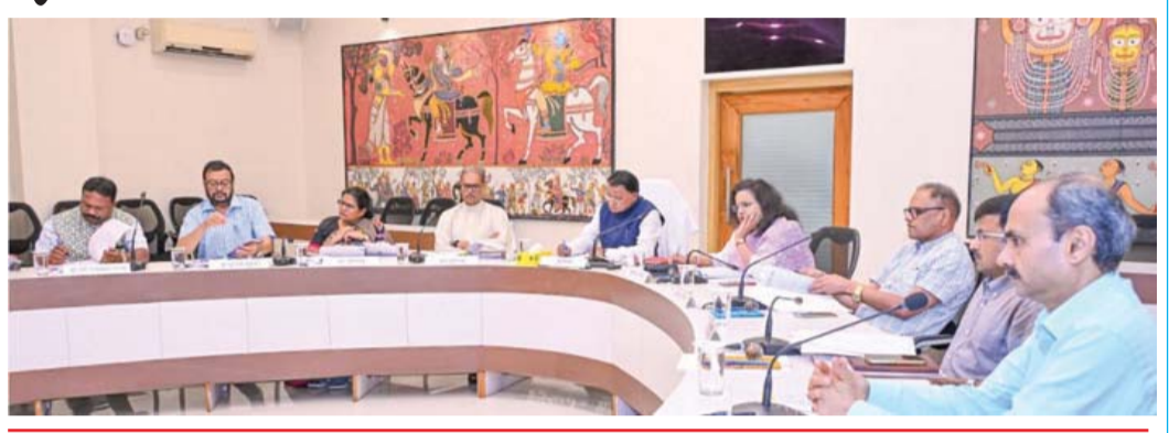
ଓଡ଼ିଶା ସିଟି ଗ୍ୟାସ୍ ବିତରଣ ନୀତି, ରାଜ୍ୟ ତଥ୍ୟ ନୀତି-୨ କୁ ମଞ୍ଜୁରୀ

ଭୁବନେଶ୍ୱର, ୨୨୧୪ ନ୍ୟୁଜ୍‌କ୍ୟୁରୋ ରାଜ୍ୟ ସରକାର କାଠଯୋଡ଼ିରେ ୮ଟି ପ୍ରସ୍ତାବକୁ ମୋହର କରିଛନ୍ତି। ଏଥିରେ କାଠଯୋଡ଼ିରେ ନୂଆ ସେତୁର ଖର୍ଚ୍ଚ ୧୫୮ କୋଟି ୮୮ ଲକ୍ଷ ଟଙ୍କା ହେବ। ଏହାଛଡ଼ା ଅନ୍ୟାନ୍ୟ ୭ଟି ପ୍ରସ୍ତାବ ମଧ୍ୟ ମୋହର ହୋଇଛି। ଏହି ପ୍ରସ୍ତାବଗୁଡ଼ିକର ବିବରଣ୍ୟ ନିମ୍ନରେ ଦିଆଯାଇଛି।