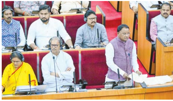
ଆଲୋଚନା ବେଳେ ଉଭୟ ବିରୋଧୀ ଏବଂ ଶାସକ ଦଳ ବିଧାୟକମାନଙ୍କ ମଧ୍ୟରେ

ଭୁବନେଶ୍ୱର, ୩୦.୫.୨୬ ନ୍ୟୁଜ୍‌କ୍ୟୁରୋ ଭାରତୀୟ ଗଣତନ୍ତ୍ରରେ ମହିଳାମାନଙ୍କ ଯୋଗଦାନ ସମ୍ପର୍କରେ ଗୁରୁତ୍ୱପୂର୍ଣ୍ଣ ବିଧାନସଭାର ଦିନିକିଆ ସ୍ୱତନ୍ତ୍ର ଅଧିବେଶନ ଆରମ୍ଭ ହୋଇଥିଲା । ତେବେ ବିରୋଧୀ ଦଳର ବିଧାୟକମାନେ ଏହି ଅଧିବେଶନ ଆରମ୍ଭକୁ ନେଇ ପ୍ରଶ୍ନ ଉଠାଇବା ସହ ସରକାରଙ୍କୁ ସମାଲୋଚନା କରିଥିଲେ । ମାତ୍ର ସରକାରଙ୍କ ପକ୍ଷରୁ ଏହାର ଯଥାର୍ଥତା ଏବଂ ପ୍ରାସଙ୍ଗିକତା ବର୍ତ୍ତମାନ ପରିସ୍ଥିତିରେ ରହିଛି ବୋଲି ଯୁକ୍ତି ଦର୍ଶାଯାଇଥିଲା । ଦିନ ତମାମ ଏହି ପ୍ରସଙ୍ଗରେ ଗୁହରେ ଚଳିଥିବା