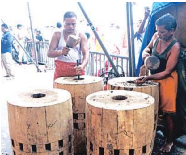
ଯୋଗାଯାଇଛି । ବିଶ୍ୱକର୍ମୀମାନେ ଏହାକୁ ଚଉପଟ କରି ରୂପକାର ସେବକଙ୍କୁ ଯୋଗାଇଦେଇ ପାରମ୍ପରିକ ବିଧି ମତେ ପୂଜାର୍ଚ୍ଚନା କରି ଗୁଜ ଅନୁକୂଳ କାର୍ଯ୍ୟ ସମ୍ପନ୍ନ କରିଥିଲେ ରୂପକାର । ଅନୁକୂଳ କାଠରେ ଗୁଜ ତିଆରି ହେବ ଅର୍ଥାତ୍ ସିଂହ ପୂର୍ଣ୍ଣ ଖୋଦେଇ ହୋଇଛି ।

ରଥ ନିର୍ମାଣ ପରମ୍ପରାର ନୃସିଂହ ଜନ୍ମଦିନ ବେଶ୍ ମହତ୍ତ୍ୱପୂର୍ଣ୍ଣ । ଗୁରୁବାର ନୃସିଂହ ଚତୁର୍ଦ୍ଦଶୀରେ ରଥର ଗୁଜ ଅନୁକୂଳ ହୋଇଛି । ରଥ ନିର୍ମାଣ କାର୍ଯ୍ୟରେ ଯୋଗଦେଇଥିଲେ ରୂପକାର ସେବକ । ତିନି ରଥର ମୁଖ୍ୟ ରୂପକାର ସେବକ ଗୁଜ ଅନୁକୂଳ କରିଥିଲେ । ଗୁଜ ରଥର ସୁରକ୍ଷା କବଚ । ସେହିପରି ନୃସିଂହ ଜନ୍ମଦିନେ ଭୋଜସେବକମାନେ ଯତ୍ନ ଗାଡ଼ ଖୋଲିଥିଲେ । ଚର୍ଚ୍ଚିକା ଠାକୁରାଣୀଙ୍କ ସମ୍ମୁଖ ବଡ଼ ଦାଣ୍ଡରେ ଯୋଗାଯାଇଛି । ବିଶ୍ୱକର୍ମୀମାନେ ଏହାକୁ ଚଉପଟ କରି ରୂପକାର ସେବକଙ୍କୁ ଯୋଗାଇଦେଇ ପାରମ୍ପରିକ ବିଧି ମତେ ପୂଜାର୍ଚ୍ଚନା କରି ଗୁଜ ଅନୁକୂଳ କାର୍ଯ୍ୟ ସମ୍ପନ୍ନ କରିଥିଲେ ରୂପକାର । ଅନୁକୂଳ କାଠରେ ଗୁଜ ତିଆରି ହେବ ଅର୍ଥାତ୍ ସିଂହ ପୂର୍ଣ୍ଣ ଖୋଦେଇ ହୋଇଛି ।