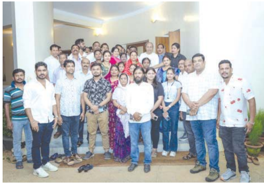
ଭୁବନେଶ୍ୱର : ସୋର ବିଧାନସଭା ନିର୍ବାଚନ ମନ୍ତ୍ରାଳୟରୁ ଅଧ୍ୟକ୍ଷ, ଜିଲ୍ଲା ପରିଷଦ ସଭ୍ୟ ଓ ସରପଞ୍ଚମାନେ ନବୀନ ନିବାସଠାରେ ବିକେଟି ସୁପ୍ରିମୋ ତଥା ବିରୋଧୀ ଦଳ ନେତା ନବୀନ ପଟ୍ଟନାୟକଙ୍କୁ ଭେଟି ସେମାନଙ୍କ ଅଞ୍ଚଳର ବିଭିନ୍ନ ସମସ୍ୟା ଜଣାଇଛନ୍ତି ।

ସେପଟେ ଯତ୍ନ ଗାଡ଼ ଖୋଲିବା ପାଇଁ ୪୦ ପୁତୁଆ କାଠ ପଡ଼ିଥିଲା । ଯତ୍ନ ଗାଡ଼ରେ ପଡ଼ି ଉତ୍ସ ସହିତ ଅର ଭୃତ୍ୟାୟାଳ ସିଙ୍ଗଡ଼ା ପ୍ରସ୍ତୁତ ହୋଇଛି । ରଥ ଖଳାରେ ବିଲେଇ ବାଡ଼ି ଆ ପକ୍ଷରେ ସିଙ୍ଗଡ଼ାରେ ପହି ସଂଯୁକ୍ତ ହୋଇ ଚକ ପ୍ରସ୍ତୁତ ହୋଇଥାଏ । ଆସନ୍ତା ୯ ତାରିଖ ଶନିବାର ମହାପ୍ରଭୁଙ୍କ ଚନ୍ଦନଯାତ୍ରାର ଭଉଁରା ଉତ୍ସବ । ରଥର ଚକ ଓ ଅଖ ସଂଯୁକ୍ତ ହେବ । ଇତିମଧ୍ୟରେ ତୁମ୍ଭରେ ବିଷ ଓ ଅଗର ବିଷ ଖୋଦେଇ ସରି ପଦାରି ଲାଗିବା ବିଷ ହୋଇଛି । କରତି ସେବକମାନେ ତୁମ୍ଭର ବଳକା ଅଂଶ କାଟି ସାଲାଇ କରୁଛନ୍ତି । ରଥ ଚକର ପହି କାଠ ଓ ଅର ପହଞ୍ଚିବାକୁ ଅପେକ୍ଷା । ଶାଳରେ ଓଝା ସେବକ ରଥ ପାଇଁ ଅର କଣ୍ଠା ନିର୍ମାଣ ସାରି ପଦାରି ତିଆରିରେ ଲାଗିଛନ୍ତି ।