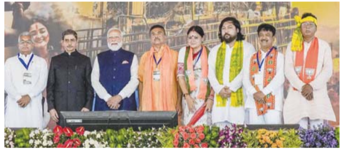
ଏହି ଶପଥ ଗ୍ରହଣ ଉତ୍ସବରେ ପ୍ରଧାନମନ୍ତ୍ରୀ ନରେନ୍ଦ୍ର ମୋଦୀ ସ୍ୱତନ୍ତ୍ର ଭାବେ ଯୋଗ ଦେଇ ଶୁଭେନ୍ଦୁଙ୍କୁ ଶୁଭେଚ୍ଛା ଜଣାଇଛନ୍ତି । ଏହା ସହିତ କେନ୍ଦ୍ର ଗୃହମନ୍ତ୍ରୀ ଅମିତ ଶାହ, (ଫୁଷା ୭ରେ)

କୋଲକାତା, ୯୮୫ ପଶ୍ଚିମବଙ୍ଗ ରାଜନୀତିରେ ଶନିବାର ଏକ ନୂତନ ଯୁଗର ଆରମ୍ଭ ହୋଇଛି । ଦୀର୍ଘ ୧୫ ବର୍ଷର ଚିଏମ୍‌ସି ଶାସନର ଅନ୍ତ ଘଟାଇ ଭାରତୀୟ ଜନତା ପାର୍ଟିର କର୍ତ୍ତୃତ୍ୱ ନେତା ଶୁଭେନ୍ଦୁ ଅଧିକାରୀ ରାଜ୍ୟର ନୂତନ ମୁଖ୍ୟମନ୍ତ୍ରୀ ଭାବେ ଶପଥ ଗ୍ରହଣ କରିଛନ୍ତି । କୋଲକାତାର ଐତିହାସିକ କ୍ରିଗେଡ଼ ପରେଡ଼ ଗ୍ରାଉଣ୍ଡଠାରେ ଆୟୋଜିତ ଏକ ଭବ୍ୟ ସମାବେଶରେ ରାଜ୍ୟପାଳ ଆର.ଏନ. ରବି ତାଙ୍କୁ ପଦ ଓ ଗୋପନୀୟତାର ଶପଥ ପାଠ କରାଇଛନ୍ତି ।