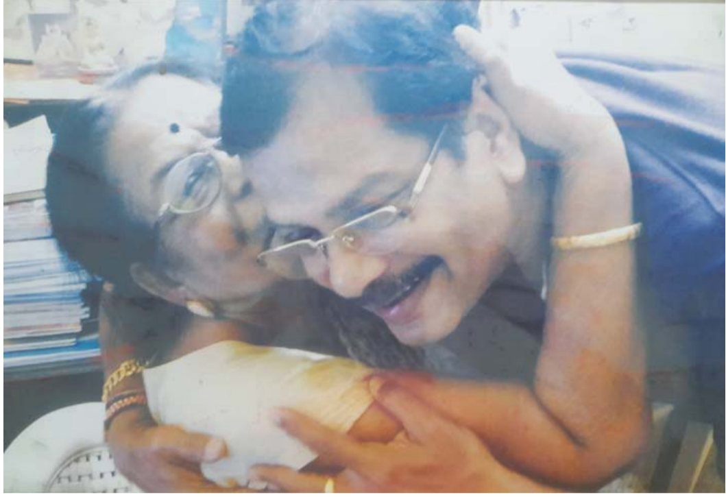
ବିଶ୍ୱ ମାତୃ ଦିବସ ଅବସରରେ ମାତୃ ସ୍ନେହର ନିଦର୍ଶନ ।