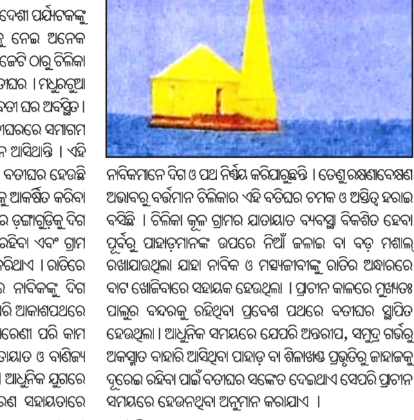
ବୁଢ଼ପୁର, ନ୍ୟୁଜ୍ କ୍ୟୁବୋ ରାମ୍ୟ ନିକଟ ଚିଲିକା ଉପକୂଳରେ ରହିଛି ବତୀଘର । ଚିଲିକା ଶୋରଣିକାକୁ ପୁରୁ ଗୁଣା କରୁଥିବା ଏହି ବତୀଘର ବିଦେଶ ପର୍ଯ୍ୟଟକଙ୍କୁ ଆକର୍ଷଣ କରୁଛି । ତେବେ ଏହି ବତୀଘରକୁ ନେଇ ଅନେକ ଲୋକଙ୍କର ଶ୍ରଦ୍ଧା ରହିଛି । ରାମ୍ୟ ପାଠନିକାଏ କେଟି ଠାକୁ ଚିଲିକା ଜଳପଥରୀ ନିକଟରେ ଥିବା ଏହି ବତୀଘର । ମଧ୍ୟରୁ ଆ ଗୋରାପୁଟରୁ ଉତ୍ତରରେ ରହିଛି ଏହି ବତୀଘର । ମଧ୍ୟରୁ ଆ ଶାନ୍ତ ଦିନେ ବିଦେଶୀ ପକ୍ଷୀ ଚିଲିକା ସହ ଏହି ବତୀଘରରେ ସମାଗମ ହୋଇଥାନ୍ତି । ଯାହାକୁ ଦେଖିବାକୁ ପର୍ଯ୍ୟଟକମାନେ ଆସିଥାନ୍ତି । ଏହି ବତୀଘର ନିକଟରେ ଅନେକ କିମ୍ବଦନ୍ତୀ ରହିଛି । ବତୀଘର ହେଉଛି ଚିଲିକା ଉପକୂଳରେ ନିର୍ମିତ ଏକ ଖଣ୍ଡ । ଚିଲିକାକୁ ଆକର୍ଷଣ କରିବା ସହ ଆଲୋକିତ କରିଥାଏ । ଏହା ଗଠିତ ସମୟରେ ତୃଣାତ୍ମକ ବିନା ନିର୍ମିତ କରିବା, ପୃଷ୍ଠିଆ ଉପକୂଳରୁ ସୁରକ୍ଷିତ ରହିବା ଏବଂ ଗ୍ରୀମ ଉପକୂଳ ଉତ୍ତରରେ ପ୍ରବେଶ କରିବାରେ ସାହାଯ୍ୟ କରିଥାଏ । ଗଠିତରେ ବହୁ ଦୂର ପର୍ଯ୍ୟନ୍ତ ଆଲୋକ ସଙ୍କେତ ଦେଇ ନାବିକଙ୍କୁ ବିନା ଉଦ୍ଧାରକାରୀରେ ସହାୟକ ହୋଇଥାଏ । ସେହିପରି ଆକାଶପଥରେ ଉଡ଼ୁଥିବା ବିମାନ ପାଇଁ ମଧ୍ୟ ଏହା ଏକ ଦିଗବାରେଣୀ ପରି କାମ କରିଥାଏ । ପୂର୍ବ କାଳରେ ଚିଲିକା ପଥରେ ଯାତାୟତ ଓ ବାଣିଜ୍ୟ ପାଇଁ ଗୁଡ଼ିକ ସ୍ଥାନେ ବଦଳିବ ନିର୍ମିତ ହୋଇଥିଲା । ଆଧୁନିକ ଯୁଗରେ ବୈଷୟିକ ଜ୍ଞାନକୌଶଳ ଓ ଆଧୁନିକ ଉପକରଣ ସହାୟତାରେ

ହୋଟେଲରେ ଖାଦ୍ୟ ପ୍ରସ୍ତୁତି ପ୍ରକ୍ରିୟା ଅତ୍ୟନ୍ତ ନିମ୍ନମାନର । ସବୁଠାରୁ ବଡ଼ କଥା ହେଉଛି ସ୍ଥାନୀୟ ଅଧିକାର କିଛି ନାହିଁ କିମ୍ବା ହୋଟେଲ ଗୁଡ଼ିକରେ ପ୍ରତିଦିନ ବାସି ଖାଦ୍ୟ ଗ୍ରାହକଙ୍କୁ ପରଷୁଛନ୍ତି । ଯାହାର ପ୍ରମାଣ ସ୍ୱରୂପ ଯଦି ଖାଦ୍ୟ ନିରାପତ୍ତା ବିଭାଗ ଅନାଦେଶ୍ୟକ ଥାଏ ହୋଟେଲରେ ଥିବା ରେଫ୍ରିଜରେଟର କିମ୍ବା ଫ୍ରିଜ୍ ଯାଞ୍ଚ କରିବେ ସତ୍ୟାସତ୍ୟ ସାମ୍ନାକୁ ଆସିବ । ଖାଦ୍ୟ ଗ୍ରାହକଙ୍କୁ ପରଷୁଛନ୍ତି, ବିଶ୍ୱାସରେ ଗ୍ରାହକ ଏହାକୁ ଖାଉଛନ୍ତି । କେବଳ ବାସି ଖାଦ୍ୟ ନୁହେଁ, ଖାଦ୍ୟ ପ୍ରସ୍ତୁତ ସ୍ଥାନ ଉପରେ ନକହିବା ଭଲ । ଅସୁସ୍ଥ୍ୟର ପରିବେଶରେ ଖାଦ୍ୟ ପ୍ରସ୍ତୁତ ହେଉଛି । ମାତ୍ର କିମ୍ବା ଦୁଇ ମାସ ନୁହେଁ ବର୍ଷ ବର୍ଷ ଧରି ଏଭଳି