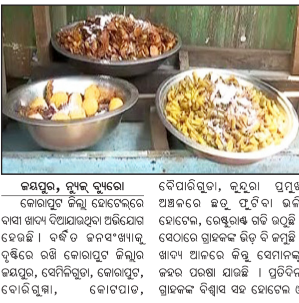
ଜୟପୁର, ନ୍ୟୁଜ୍ କ୍ୟୁବୋ କୋରାପୁଟ ଜିଲ୍ଲା ହୋଟେଲରେ ବାସି ଖାଦ୍ୟ ଦିଆଯାଉଥିବା ଅଭିଯୋଗ ହେଉଛି । ବର୍ଷ ଚ ଜନସଂଖ୍ୟାକୁ ଦୃଷ୍ଟିରେ ରଖି କୋରାପୁଟ ଜିଲ୍ଲାର ଜୟପୁର, ସେମିକିଗୁଡା, କୋରାପୁଟ, ବୋରିଗୁମ୍ମା, କୋଟପାଟା,

ରେଷୁରାଖ କର୍ତ୍ତୃପକ୍ଷ ଖେଳୁଥିବା ବେଳେ ଖାଦ୍ୟ ସୁରକ୍ଷା ବିଭାଗ ନିୟୋଜିତ ନିଦରେ ଶୋଇ ରହିବା ସମସ୍ତଙ୍କୁ ଅଣ୍ଟାରେ କରିଛି । ଅଭିଯୋଗ ହେଲେ କାଁ ଭା ଚତୁର୍ଥ କରି ନିଜ ଦାୟିତ୍ୱ ତୁଲାଇ ଦେଉଛି ପ୍ରଶାସନ । ପ୍ରତ୍ୟେକ ଦିନ ରାଜ୍ୟର କୋଣ ଅନୁ କୋଣରୁ କୋରାପୁଟ ଜିଲ୍ଲାରୁ ପରିବର୍ତ୍ତନ କରିବାକୁ ଆସି ଅଧିକାର ବିଭିନ୍ନ ହୋଟେଲରେ ଖାଦ୍ୟ ଖାଉଛନ୍ତି । ମାତ୍ର ହୋଟେଲ କର୍ତ୍ତୃପକ୍ଷ ବାସି ଚାକରକମ୍ପ୍ୟୁଟର ଗୁରୁତ୍ୱ ଦେଉଥିବା ବେଳେ ଖାଦ୍ୟ ପ୍ରସ୍ତୁତି ଦିଗରେ ଯତ୍ନବାନ ହେଉନାହାନ୍ତି । ଫଳ ସ୍ୱରୂପ ପ୍ରତିଦିନ ଗ୍ରାହକ ଚଳା ଦେଇ ବାସି ଓ ଅପରିଷ୍କୃତ ଖାଦ୍ୟ ଖାଉଛନ୍ତି । ଅଧିକରେ ଶତାଧିକ ହୋଟେଲ ଅଛି । ଅନେକ