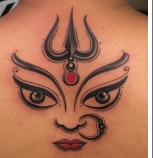
ହେପାଟାଇଟିସ୍ ବି ଟାଟା ନେବା ଲାଗଇବା ଜରୁରୀ । ଡାକ୍ତରଙ୍କ ପରାମର୍ଶ ନେଇ ଟାଟୁ କରିବାକୁ ଉଚ୍ଚତମ ନୁହେଁ ।

ଟାଟୁ ମାନିଆ । ସବୁ ବର୍ଗର ଲୋକଙ୍କୁ କ୍ରେଲି କରୁଛି ଟାଟୁ । ପିଲାଙ୍କ ଠାରୁ ବୟସ୍କ ଏମିତିକି ମହିଳା ବି ଟାଟୁ ନିଶାରେ ଶରୀରର ବିଭିନ୍ନ ଅଙ୍ଗରେ ଟାଟୁ ଟିଆରି କରି ଡେଇଁଛନ୍ତି ବହୁଛନ୍ତି ସମସ୍ତେ । ଏମିତିକି ଟାଟୁ ବି ମଣିଷର ପରିଚୟ ଦେଉଛି । ଅର୍ଥାତ୍ ଅନେକ ଦୁର୍ଘଟଣାରେ ଟାଟୁ ଦେଖି ପରିଚୟ ମିଳିପାରୁଛି । କିନ୍ତୁ ଆପଣ ଜାଣନ୍ତି କି ? ଟାଟୁ ଆଣିପାରେ ବିପଦ । ଚର୍ଚ୍ଚି ରୋଗ ଠାରୁ ଏଠି ଯାଏଁ ହୋଇପାରେ ଟାଟୁ । ଟାଟୁରେ ବ୍ୟବହୃତ ଛୁଆଁ, କେମିକାଲ ଆଦି ରୋଗକୁ ଡାକିଥାନ୍ତି । ଟାଟୁ ଟିଆରି କରିବା ପାଇଁ ନାଲ ରଙ୍ଗ କ୍ରେଲିକାରକ । ଏଥିରେ ଆଲୁମିନିୟମ ଓ କୋବାଲ୍ ଆଦି ବ୍ୟବହାର ହୋଇଥାଏ । ପିଲାଙ୍କୁ ଡାକି ପାଇଁ ଏହା ମାଗାମୁକ । ଟାଟୁରେ ବ୍ୟବହୃତ ଛୁଆଁ ମାଂସପେଶୀକୁ ଦୁର୍ବଳ କରାଏ । ଟାଟୁ କରିବା ପୂର୍ବରୁ ଭଲ ସମସ୍ୟାରୁ ମୁକ୍ତି ମିଳିପାରେ ।