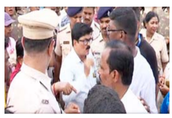
ଅଭିଯୋଗ ଘଟଣାରେ ପୁଣି ତାତିଲେ ଲୋକେ । ଆହତ ସୁବକ୍ତା ସ୍ୱାସ୍ଥ୍ୟକ୍ଷେତ୍ର ବିଗୁରୁଥିବା ଏବଂ ତାଙ୍କୁ ପରିବାର ଲୋକଙ୍କୁ ଭେଟିବାକୁ ସୁଯୋଗ ମିଳୁନଥିବା ଅଭିଯୋଗ ପରେ ଶୁକ୍ରବାର ପୁଣି

କଟକ, ୨୯ ମଇ : ନ୍ୟୁଜ୍ ବ୍ୟୁରୋ ବାରଙ୍ଗ ଥାନାରେ ଆର୍ଡି ତିଗ୍ରୀ ଅଭିଯୋଗ ଘଟଣା ଶୁକ୍ରବାର ଉତ୍ତର ପକ୍ଷରେ ପୋଲିସ୍ କମିଶନରଙ୍କଠାରୁ ରିପୋର୍ଟ ତଲବ କରିଛନ୍ତି ପୋଲିସ୍ ତିଜି । ଆଉ ରିପୋର୍ଟ ଦେଖିବା ପରେ ପରବର୍ତ୍ତୀ ପଦକ୍ଷେପ ନିଆଯିବ ବୋଲି ତିଜି କହିଛନ୍ତି । ଲୋକଙ୍କ ପ୍ରବଳ ଆକ୍ରୋଶକୁ ଦେଖି କୌଣସି ଅଘଟଣା ଆଶଙ୍କାରେ ବାରଙ୍ଗ ଥାନାକୁ ବ୍ୟାପକ ପୋଲିସ୍ ଘେରି ରହିଛନ୍ତି ।