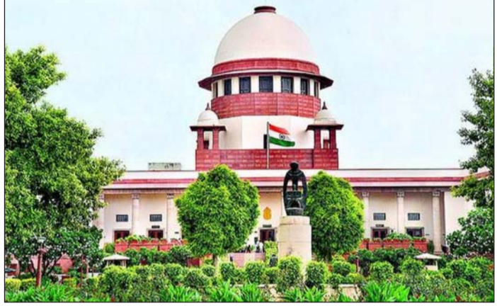
ନିର୍ଦ୍ଦେଶାଳୀଙ୍କୁ ପ୍ରଧାନମନ୍ତ୍ରୀଙ୍କ ନଜର ରଖିବେ ବୋଲି କେନ୍ଦ୍ର ସରକାର କହିଛନ୍ତି।

ନୂଆଦିଲ୍ଲୀ, ୨୯ ମଇ ନିର୍ଦ୍ଦେଶାଳୀଙ୍କୁ ପ୍ରଧାନମନ୍ତ୍ରୀଙ୍କ ନଜର ରଖିବେ ବୋଲି କେନ୍ଦ୍ର ସରକାର କହିଛନ୍ତି। ପ୍ରଧାନମନ୍ତ୍ରୀ ନରେନ୍ଦ୍ର ମୋଦୀ ନିଜେ ଏହି ମାମଲା ଉପରେ ନଜର ରଖିବେ।