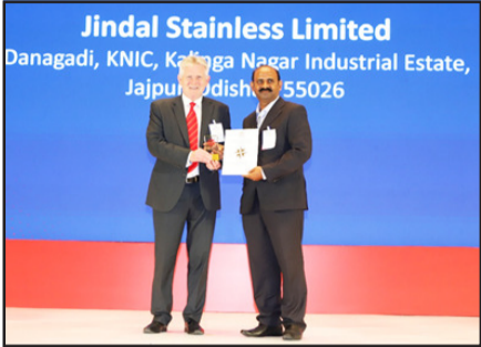
କଳିଙ୍ଗନଗର, ନ୍ୟୁକ୍ ବ୍ୟବସ୍ଥା ଉଦ୍ୟୋଗିକ ସୁରକ୍ଷା, କାର୍ଯ୍ୟସୁକ୍ତ ପୁରଣା ସଂସ୍କୃତି ଏବଂ ଶୁଦ୍ଧ ପୂର୍ବଗଣା ଲକ୍ଷ୍ୟରେ ନିରନ୍ତର ଉତ୍ତମ ପ୍ରଦର୍ଶନ କରି ଯାକପୁର ସ୍ଥିତ ଜିନ୍ଦାଲ୍ ସ୍ଟେନଲେସ୍ ଲିମିଟେଡ୍ (JSL) ପୁଣିଥରେ ଜାତୀୟ ଓ ଆନ୍ତର୍ଜାତୀୟ ମାଧ୍ୟମରେ ଓଡ଼ିଶାର ଗୌରବ ବୃଦ୍ଧି କରିଛି । ଚଳିତ ବର୍ଷ କମ୍ପାନୀ, ପ୍ରତିଷ୍ଠିତ ବ୍ରିଟିଶ ସେପ୍ଟିକାଉନସିଲ୍ (JSL) ଓ ଆଇସିସିର ଲିଡରସିପ୍ ଆଡ଼ାଡ଼ି ଏବଂ ଇଣ୍ଡିଆନ୍ ଚାମ୍ପିୟନ୍ସ (ICC) ଲିଡରସିପ୍ ଆଡ଼ାଡ଼ି ହାସଲ କରି ପୁରଣା