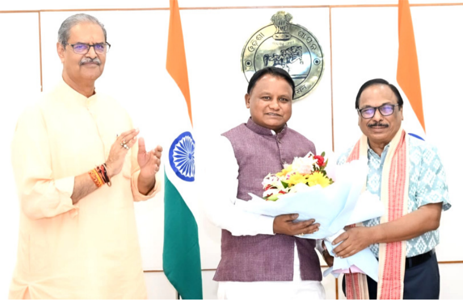
ଭୁବନେଶ୍ୱର : ଲୋକସେବା ଭବନରେ ପ୍ରତିଷ୍ଠିତ ଭାଷାବିତ୍ ଲୋକ ସାହିତ୍ୟ ଗବେଷକ ପଦ୍ମଶ୍ରୀ ଡ. ମହେନ୍ଦ୍ର କୁମାର ମିଶ୍ରଙ୍କୁ ମୁଖ୍ୟମନ୍ତ୍ରୀ ମୋହନ ଚରଣ ମାଝୀ ସମର୍ଥନ କରୁଛନ୍ତି । ନିକଟରେ ଉପସ୍ଥିତ ଅଛନ୍ତି ଉପମୁଖ୍ୟମନ୍ତ୍ରୀ ଜନକ ବର୍ଦ୍ଧନ ସିଂହଦେଓ ।