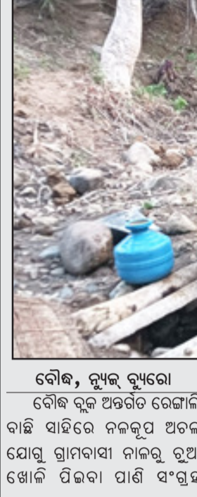
ବୌଦ୍ଧ, ନ୍ୟୁକ୍ ବ୍ୟବସ୍ଥା ବୌଦ୍ଧ ବୃକ୍ଷ ଅନ୍ତର୍ଗତ ରେଙ୍ଗାଳି ବାଢ଼ି ସାହିରେ ନଳକୂଅ ଅଚଳ ଯୋଗୁ ଗ୍ରାମବାସୀ ନାଲି ରୁଆ ଖୋଳି ପିଇବା ପାଣି ସଂଗୃହ

ନାଲରେ ରୁଆ ଖୋଳି ପିଇବା ପାଣି ସଂଗୃହ କରୁଥିବା ଅଭିଯୋଗ ହୋଇଛି । ଦାବି ଦିନ ହେଲେ ନଳକୂଅ ଅଚଳ ଥିବା ବେଳେ ନଳକୂଅ ମରାମତି ପାଇଁ ବାଢ଼ି ସାହିବାସୀ ବନ୍ଦିଆପତା ସରପଞ୍ଚ, ପ୍ରଧାନତ ନିର୍ବାହୀ ଅଧିକାରୀଙ୍କୁ ବାରମ୍ବାର ଜଣାଇବା ପରେ ମଧ୍ୟ ନଳକୂଅ ମରାମତି ପାଇଁ କେହି ଆସୁନଥିବା ସେମାନେ ଅଭିଯୋଗ କରିଛନ୍ତି । ସରପଞ୍ଚ ଅନୁଜ୍ଞା ଦାମ୍ଭକ୍ତ ଲୋକେ ଯୋଗାଯୋଗ କରିଥିବା ବେଳେ ସେ ନିଜ ଉପରୁ ଦାୟିତ୍ୱ ଖସାଇ ପୁଁ ବୁଲୁଛନ୍ତି କେବଳ ବେଳେ, ବୁଲୁଛନ୍ତି ଗାଡ଼ି ପଠେଇଲେ ମରାମତି ହେବ ବୋଲି କହୁଛନ୍ତି । ବର୍ତ୍ତମାନ ନାଲି ରୁଆ କରି ପାଣି ଆଣି ବ୍ୟବହାର କରୁଛନ୍ତି । ଯଥାଶକ୍ତ ନଳକୂଅ ମରାମତି ପାଇଁ ବୁକ୍ ତଥା କିଛି ପ୍ରଶାସନକୁ ସାହି ବାସିନ୍ଦା ଅନୁରୋଧ କରିଛନ୍ତି ।