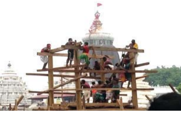
ନାହାକା ଉଠିବ । ଚଳିତ ବର୍ଷ କେନ୍ଦ୍ର ମାସରେ ମଳ ମାସ ବା ଅତିରିକ୍ତ ମାସ ଯୋଗ ହୋଇଥିବା ଯୋଗୁଁ ଏଥର ସଫଳ ଚାଲିଛି ନିର୍ମାଣ କାର୍ଯ୍ୟ । ସେପଟେ ରୂପକାର ସେବକମାନେ ତିନିରଥର ବେଦୀ ସିଂହାସନ ପୂର୍ଣ୍ଣାଙ୍ଗରେ ଚିତ୍ର ରୂପ ଖୋଦନ ଶେଷ କରିବା ସହ ରୂପ ସୂତ୍ରକର ପଲ୍ଲୀ କାର୍ଯ୍ୟ ଶେଷ

ପୁରୀ, ୮/୦୬ ନ୍ୟୁଜ୍ ବ୍ୟୁରୋ ୪୯ ଦିନରେ ଚଳଚ୍ଚିତ୍ର ରଥଖଳା ଯୋଗ୍ୟ ରଥ ଉପରକୁ ଉଠିଛି ଛଅ କାଠ । ଭୋଇ ସେବକ ପକାଇଛନ୍ତି ଚତୁର୍ଥ ହରିବୋଲ । ୨୦୪ ସେବକଙ୍କ ଉପସ୍ଥିତିରେ ଚାଲିଛି ନିର୍ମାଣ କାର୍ଯ୍ୟ । ତିନି ରଥରେ ଛନ୍ଦ ଗଢ଼ା ଯୋଗ୍ୟ କାର୍ଯ୍ୟ ଶେଷ ହୋଇ ଯୋଖା ଫିଟିଂ କାର୍ଯ୍ୟ ମଧ୍ୟ ଶେଷ ହୋଇ ଯାଇଛି । ୩ ଟି ରଥରେ ସମୁଦାୟ ୪୪୮ ଯୋଖା ସଂଯୋଗ ହୋଇଛି । ଏହାପରେ ପ୍ରଥମ ଭୂର୍ଣ୍ଣ ରଥ ଉପରକୁ ଯୋଗାଇ ଦେଇଥିଲେ ଭୋଇ ସେବକ । ସମାପ୍ତ ହୋଇ ଭାବରେ ତିନି ରଥର ଚାଳିରେ କାର୍ଯ୍ୟ ଜାରି ରହିଥିବା ବେଳେ ଯୋଗ୍ୟ ରଥ ଉପରକୁ ୬ କାଠ ଉଠିଛି । ପୂର୍ବରୁ ୬ କାଠ ଟ୍ରେମ୍ ପ୍ରସ୍ତୁତ କରିଥିଲେ । ୬ କାଠ ଉଠିବା ପରେ ଭୋଇ ସେବକମାନେ ଚତୁର୍ଥ ହରିବୋଲ ଦେଇଛନ୍ତି । ଏହାପରେ ଭୂର୍ଣ୍ଣ ସଂଯୋଗ ସହ ଚତୁର୍ଥ