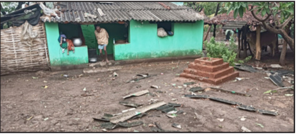
ପୋତଗଡ଼ ସମେତ ବିଭିନ୍ନ ଅଞ୍ଚଳରେ ବଡ଼ ବଡ଼ ଗଛ ପଡ଼ିବା ସହ କେତେକ ଜାଗାରେ ଘର ଭାଙ୍ଗି ଯାଇଥିବାର

ଉତ୍ତରକୋଟ, ନ୍ୟୁଜ୍ ବ୍ୟୁରୋ ଉତ୍ତରକୋଟ ରୁକ୍ମିଣୀ ବିଭିନ୍ନ ଅଞ୍ଚଳରେ ଘଡ଼ ଘଡ଼ି ବର୍ଷା ଓ କାଳବୈଶାଖୀ ତାଣ୍ଡବରେ ଜନଜୀବନ ଅସ୍ତବ୍ୟସ୍ତ ହେଇପଡ଼ିଛି । ସୂଚନା ଅନୁସାରେ ମଙ୍ଗଳବାର ଅପରାହ୍ଣ ୩ଟାରେ ଆକାଶ ମେଘାହଳୁ ହେଇଆସିଥିଲା । ପରେ ପରେ ଜୋରରେ ପବନ ବର୍ଷା ହେଇଥିଲା । ଯେଉଁଥିପାଇଁ ଧୋଡ଼ା, ସିଙ୍ଗାପା, ବଡ଼ ଭରଣା, ପୂଜାରୀଗୁଡ଼ା, ବାଟିବେତା,