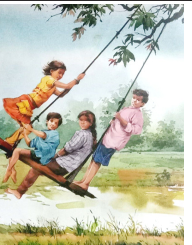
ଗଣ ପରବ ରଜ ...

ଆଶଙ୍କାରେ ପରିଣତ ହେଲା । ବିଶ୍ୱରୂପଙ୍କ ପିତା ବୃଷା, କିନ୍ତୁ ମାଆ ଅସୁର ବଂଶଜ । ଭଲକର ଆଶଙ୍କା ହେଲା; ହୁଏତ ବିଶ୍ୱରୂପ ଅସୁରକୁଳକୁ ସାହାଯ୍ୟ କରିପାରନ୍ତି । ଏବଂ ଖୁବ୍ ଶୀଘ୍ର ତାଙ୍କ ଆଶଙ୍କା ସତ୍ୟରେ ପରିଣତ ହେଲା । ସେ ଶୁଣିଲେ, ବିଶ୍ୱରୂପ ଯଜ୍ଞର ହବିର୍ଭାଗ ଅସୁରମାନଙ୍କୁ ଦେବାପନରେ ଅର୍ପଣ କରୁଛନ୍ତି । ସେ କ୍ରୋଧବଶେ ଦିନେ ବିଶ୍ୱରୂପଙ୍କୁ ବନ୍ଧୁ ଭାବେ ହତ୍ୟା କଲେ । ବାସ୍ ! ବହୁହତ୍ୟା ଦୋଷ ଲାଗିଲା ଭଲକୁ । ଅନ୍ୟପକ୍ଷରେ ବୃଷା ପୁଅର ମୃତ୍ୟୁ ସଂପର୍କରେ ଯଥା ସମୟରେ ଶୁଣିଲେ । ଭଲ ଉପରେ ପ୍ରତିଶୋଧ ନେବାପାଇଁ ସେ ଏକ ବିରାଟ ଯଜ୍ଞାଦୁଷ୍ଟାନ କଲେ । - ଯଜ୍ଞରୁ ଜନ୍ମହେଲା ଏକ ଶକ୍ତିଶାଳୀ ଭୟଙ୍କର ଦର୍ଶନ ଅସୁର, ଯାହାର ନାମ ବୃତ୍ତ । ସେ ବୃତ୍ତକୁ ଆଦେଶ ଦେଲେ, ଦେବତାମାନଙ୍କ ରାଜା ଭଲକୁ ବଧକର ! (କୁମାର...) ନରଣପୁର, କୋଦଣ୍ଡପୁର ଯାକପୁର ଗାନ୍ଧୀ-୬ ମୋ-୮୨୪୯୨୧୩୩୦୮