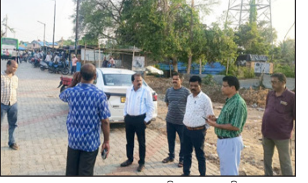
ବସ୍ତାଖଣ୍ଡରେ ଥିବା ଅସ୍ଥାୟୀ ଆସିଥିବାରୁ ସକ୍ରିତ ହେଉଥିବା ଦୋକାନୀମାନେ ଆଗକୁ ମାଡ଼ି ବସ୍ତାଖଣ୍ଡକୁ ପ୍ରସାରିତ କରିବା ପାଇଁ