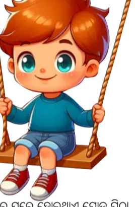
ଘରେ ଘରେ ହୋଇଥାଏ ପୋଡ଼ି ପିଠା ସୁଆପ ତାହାର ବଡ଼ ନିଆରା, ମାଆ ବାଣିଆଣି ସାଜ ପଡ଼ିଶାରେ ଭାବ ବନ୍ଧନର ପ୍ରୀତି ପାଏତା ।

ଆମ ପରମ୍ପରା ଆମରି ସଂସ୍କୃତି ଦେଖରେ ଦେଖରେ କେତେ ମହାନ, ଏହି ରଜ ପର୍ବ ତାହାର ପ୍ରତୀକ ଘରେ ଘରେ ହୋଇଥାଏ ପାଳନ ।।। ପ୍ରଧାନ ଶିକ୍ଷକ, ଶକ୍ତି ବିହାର, ବାଲିପଡ଼ା, ମାହାଙ୍ଗା, କଟକ ମୋ-୭୬୦୯୦୪୫୩୩୩