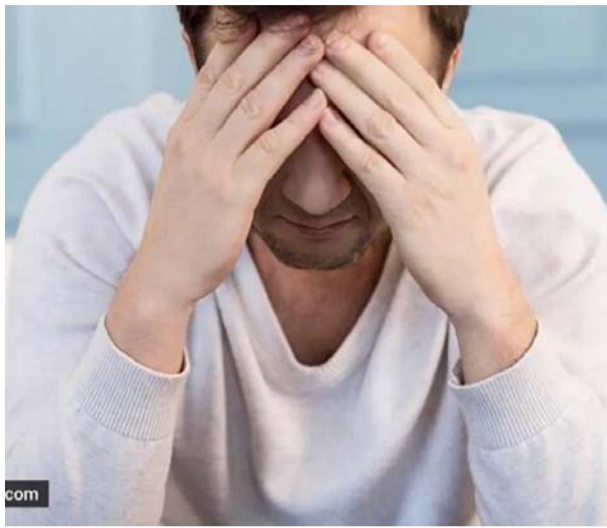
ମଧ୍ୟପ୍ରଦେଶ ଦେଶରେ ତୃତୀୟ ଭାବନାତ୍ମକ ଚାପ ଯୋଗୁଁ ସୁାନରେ ଅଛି । ଶୈକ୍ଷିକ ଓ ଛାତ୍ରମାନଙ୍କ (୭୧ ଜଣ)

ନ୍ୟାସନାଲ କ୍ରାଇମ ରେକର୍ଡିଂ ବ୍ୟୁରୋର ୨୦୨୪ ରିପୋର୍ଟ ଅନୁଯାୟୀ, ଭାରତରେ ମାନସିକ ସ୍ୱାସ୍ଥ୍ୟ ଏକ ବଡ଼ ଚ୍ୟାଲେଞ୍ଜ ଭାବେ ଉଭା ହୋଇଛି । କେବଳ ମଧ୍ୟପ୍ରଦେଶରେ ବର୍ଷକ ମଧ୍ୟରେ ୧୫,୪୯୧ ଜଣ ଲୋକ ଆତ୍ମହତ୍ୟା କରିଛନ୍ତି, ଯାହା ଏକ ଗମ୍ଭୀର ସଙ୍କଟକୁ ଦର୍ଶାଉଛି ।