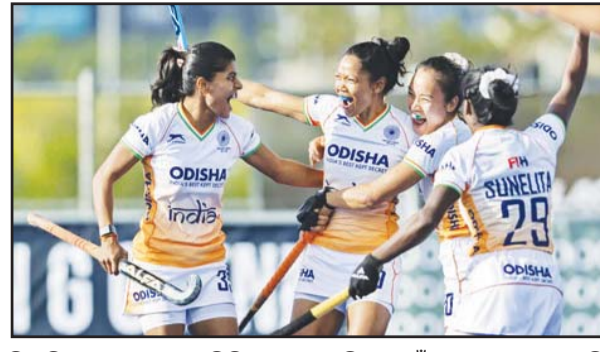
ହିରାନିପୁ ଆଇ ମ୍ୟାଚରେ ମିନିଟରେ ଗୋଲ ଦେଇଥିଲେ କିନ୍ତୁ ଭାରତର ଅଗ୍ରଣୀୟ ଅତିକ୍ରମ କରିବା ପାଇଁ ତାଙ୍କୁ ଅନ୍ୟ କୌଣସି ଖେଳାଳିଙ୍କ ସହଯୋଗ ମିଳିନଥିଲା ।

ଓକଲାସ ଭାରତୀୟ ମହିଳା ହକି ଦଳ ଏଫଆଇଏଚ୍ ମହିଳା ନେସନ୍ସ କପ୍ ୨୦୨୨ରେ ସେମିଫାଇନାଲରେ ନିଜ ସ୍ଥାନ ପକ୍କୁ କରିଛି । ଓକଲାସର ନର୍ଥ ହାର୍ଭର ନ୍ୟାସନାଲ ହକି ସେଣ୍ଟରରେ ଖେଳାଯାଇଥିବା ପୁଲ୍-ଏଫ ନିଜର ଦ୍ୱିତୀୟ ମ୍ୟାଚରେ ଭାରତ ୨-୧ ଗୋଲରେ ଜାପାନକୁ ପରାସ୍ତ କରିଛି ।