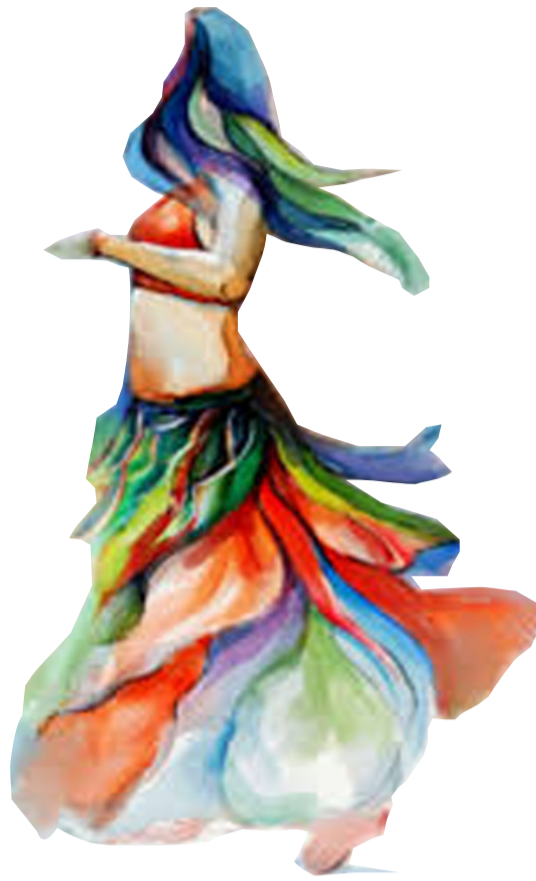
ମଞ୍ଚୁଆ, କେନ୍ଦୁଝର ଗଡ଼ ମୋ - ୯୪୩୭୭୫୨୩୯୫