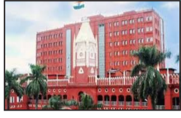
କମିଶନ ତଦନ୍ତ ରିପୋର୍ଟ ନିଖୋଜ ହେବା ଉପରେ ଚିନ୍ତା ପ୍ରକାଶ କରିଛି। ଏହି ପ୍ରସଙ୍ଗକୁ