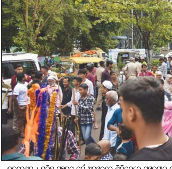
କୁବନେଶ୍ୱର : ପବିତ୍ର ମହରମ ପର୍ବ ଅବସରରେ ଶିବପୁରରେ ମୁସଲମାନ ଭାଇମାନଙ୍କ ପକ୍ଷରୁ ବାହାରିଥିବା ତାଜିଆ ଶୋଭାଯାତ୍ରା।

ମୁଖ୍ୟମନ୍ତ୍ରୀ ନିଜ ଅଭିଭାଷଣରେ ସମସ୍ତ ଶିକ୍ଷାଦାତା ମାନଙ୍କୁ କହିଥିଲେ ଯେ, ବିଗତ କିଛି ଦଶକ ଧରି ଭାରତର ଅର୍ଥନୈତିକ ଅଭିବୃଦ୍ଧି ମୁଖ୍ୟତଃ ପଶ୍ଚିମ ଓ ଦକ୍ଷିଣ ଭାରତର ଉପରେ ନିର୍ଭର କରୁଥିଲା। ମାତ୍ର ବର୍ତ୍ତମାନ ଭାରତର ବିକାଶ କାହାଣୀର ପରବର୍ତ୍ତୀ ବଡ଼ ଅଧ୍ୟାୟ ପୂର୍ବ ଭାରତରେ ଲେଖାଯାଉଛି। ପ୍ରଭୁତ ଖଣିଜ ସଂପାଦନ, ବ୍ୟାପକ କୃଷି ସମ୍ଭବନା, ଦୀର୍ଘ ଚଳନେଶା ଏବଂ ଏକ ସୁବ ଚୟା ଆଶାବାଦୀ କାର୍ଯ୍ୟକ୍ରମ ଯୋଗୁଁ ଏହି ଅଞ୍ଚଳ ଦ୍ରୁତ ଗତିରେ ଆଗକୁ ବଢୁଛି। ଆମର ଲକ୍ଷ୍ୟ ହେଉଛି ‘ସମଗ୍ର ଓଡ଼ିଶା ୨୦୩୬’ ଭିଜନକୁ ‘ବିକଶିତ ଭାରତ ୨୦୪୭’ ସହିତ ଯୋଡ଼ି ରାଜ୍ୟକୁ ପୂର୍ବ ଭାରତର ସବୁଠାରୁ ନିବେଶକ-ଅନୁକୂଳ ସ୍ଥାନ ଭାବେ ଗଠି ଦେଖାଇବା। ଏହି ରୂପାନ୍ତରଣ ଯାତ୍ରାରେ