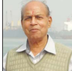
ପରିବାର ସ୍ମରଣ ଉପସ୍ଥିତ ଥିଲେ।

ରାଜନୀତି, ପ୍ରଶାସନ ଓ ଜନକଲ୍ୟାଣକାରୀ ବିଷୟ ଉପରେ ତାଙ୍କର ଗଭୀର ଜ୍ଞାନ ଓ ସ୍ୱଳ୍ପ ବିଶ୍ୱେଷଣ ସାମ୍ବାଦିକତା ଜଗତରେ ଏକ ମାନଦଣ୍ଡ ସୃଷ୍ଟି କରିଥିଲା। ତାଙ୍କର ବିୟୋଗ ଓଡ଼ିଶାର ଗଣମାଧ୍ୟମ ଜଗତ ପାଇଁ ଏକ ଅପୂର୍ବଶୋକ ଛାଡ଼ି ଯାଇଛି। ଏହି ଦୁଃଖର ସମୟରେ ଶୋକସମସ୍ତ ପରିବାରବର୍ଗଙ୍କ ପ୍ରତି ମୋର ଗଭୀର ସମ୍ବେଦନା ଜଣାଇବା ସହ ଅମର ଆତ୍ମାର ସ୍ୱଚ୍ଚତା କାମନା କରୁଛି।