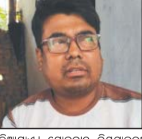
ଦିଆଯାଏ। ଯୋଜନାର ନିୟମାବଳୀ ଅନୁଯାୟୀ ଅଭିଯୋଗକାରୀ ଦାଖଲ ହୋଇଥିବା ବେଳେ ଗିରଫ ହୋଇଛନ୍ତି। ଲାଞ୍ଚ ନେଉଥିବା ବେଳେ ଗିରଫ ହୋଇଛନ୍ତି।

କରିଥିଲେ। ଏପରିକି ଲାଞ୍ଚ ନେବେଳେ ତାଙ୍କ ସମେତ ଗାଁର ଅନ୍ୟ ହିତାଧିକାରୀ ସର୍ବସ୍ୱତ୍ୱ ମଧ୍ୟ ବନ୍ଦ କରିଦେବ ବୋଲି ଅନୁମୋଦିତ ହୋଇଥିଲା। ଲାଞ୍ଚ ନେଉଥିବା ବେଳେ ଗିରଫ ହୋଇଛନ୍ତି। ଲାଞ୍ଚ ନେଉଥିବା ବେଳେ ଗିରଫ ହୋଇଛନ୍ତି।