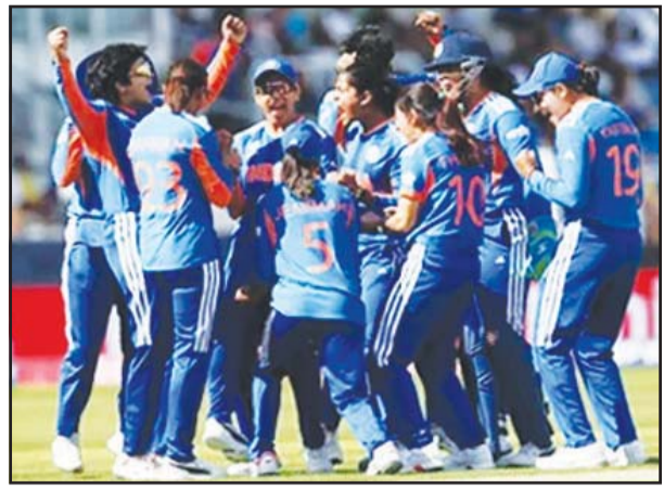
ହିସାବରେ ଦଳ ଚୟନ ହେବ। ଭାରତୀୟ ମହିଳା ଦଳ ସହ ଅଷ୍ଟ୍ରେଲିଆ, ଗ୍ରେଟ୍ ବ୍ରିଟେନ୍ ଏବଂ ଦକ୍ଷିଣ ଆଫ୍ରିକା ମଧ୍ୟ ଯୋଗ୍ୟତା ଅର୍ଜନ କରିଛନ୍ତି। ସେପଟେ କିନ୍ତୁ ଖେଳାଯାଉଥିବା ମହିଳା ଟି-୨୦

ଦିଶ୍ୱର ଗୁପ୍ତ ପର୍ଯ୍ୟାୟରୁ ବାଦ୍ ପଡ଼ିଛି ଭାରତୀୟ ମହିଳା ଦଳ। ରବିବାର ଖେଳାଯାଇଥିବା ଅଷ୍ଟ୍ରେଲିଆ ବିପକ୍ଷ ମ୍ୟାଚ୍‌ରେ ପରାଜୟ ପରେ ସେହି ରେସ୍‌କୁ ବାଦ୍ ପଡ଼ିଛି ଟିମ୍ ଇଣ୍ଡିଆ। ତେବେ ପୁରୁଷ ଦଳକୁ ଯୋଗ୍ୟତା ଅର୍ଜନ କରିବା ପାଇଁ ୬ ମାସ ଅପେକ୍ଷା କରିବାକୁ ପଡ଼ିବ। କର୍ମ-ଅଫ୍ ସମୟ ରହିଛି ତିନିସପ୍ତାହ ୩୧, ୨୦୨୨। ଭାରତ ସିଧାସଳଖ ଯୋଗ୍ୟତା କରିବାକୁ ହେଲେ ଏସୀଆରେ ଟି-୨୦ ରାକିଂରେ ନମ୍ବର ଓଁନ ହେବାକୁ ପଡ଼ିବ। ଭାରତ ଏବେ ଆୟର୍ଲାଣ୍ଡଠାରୁ ଦୁଇ ମ୍ୟାଚ୍ ବିଶିଷ୍ଟ ଟି-୨୦ ସିରିଜକୁ ହାରିଛି। ଯଦିକି ଦଳ ଉପରେ ପ୍ରଭାବ ପକାଇବ।