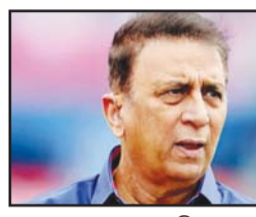
ଆଶା କରୁଥିଲେ। ଏପରି କରାଯାଇ ନ ଥିବାରୁ ସେ ରୁଦ୍ଧି ଏକାନ୍ତ ଚୟନକୁ ନେଇ ପ୍ରଶ୍ନ ଉଠାଇଛନ୍ତି। ସେ କହିଛନ୍ତି ଯେ ଭାରତୀୟ ଦଳ ନିଜର ବର୍ତ୍ତମାନ

ଓପନର ଅଭିଷେକ ଶର୍ମା ଓ ସଂଳୁ ସାମସ୍‌ନାୟକ ମଧ୍ୟରେ ଅଦଳବଦଳ କରି ଉତ୍ତରୀ ଯାକ ମ୍ୟାଚ୍‌ରେ ସୂର୍ଯ୍ୟବଂଶୀଙ୍କୁ ଖେଳାଇ ଥିବା ବୋଲି ସେ ଆଶା କରୁଥିଲେ। ଏପରି କରାଯାଇଥିଲେ ଇଂଲଣ୍ଡ ମ୍ୟାଚ୍ ପୂର୍ବରୁ ତାଙ୍କ ଉପରେ ଅନ୍ତର୍ଜାତୀୟ ପଦାପଣ ଚାପ କିଛିତା ହ୍ରାସ ପାଇଥାନ୍ତା। “ମୁଁ ଭାବୁଥିଲି ଇଂଲଣ୍ଡ ପରି ଆୟର୍ଲାଣ୍ଡ ଏକ ଶୁଖିଲା ପ୍ରତିଦ୍ୱନ୍ଦ୍ୱ ହୋଇନଥିବାରୁ ସେଠାରେ ବୈଭବଙ୍କୁ ଖେଳାଇବେ। ପ୍ରଥମ ମ୍ୟାଚ୍‌ରେ ସେ ଅଭିଷେକ କିମ୍ବା ସଂଳୁଙ୍କ ସହ ଓପନିଂ କରିଥାନ୍ତେ ଓ ଦ୍ୱିତୀୟ ମ୍ୟାଚ୍‌ରେ ସେମାନଙ୍କ ମଧ୍ୟରୁ ଜଣକ ସହ ଓପନିଂ କରି ଥାନ୍ତେ। ବୈଭବଙ୍କ ପରି ଖେଳାଳିଙ୍କୁ ଦଳ ଅଧିକ ଦୃଢ଼ ହେଉଥିବା ଦେଖିବାକୁ ପଡ଼ିବ।” ସେ କହିଛନ୍ତି।