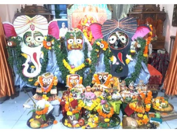
ନାଭି ମୁୟାଲର ଖରଘର ସେକ୍ଟର ୩, ବାଲିକି ଆଜ୍ଞାନସ୍ଥିତ ମନ୍ଦିରରେ ଶ୍ରୀଜଗନ୍ନାଥଙ୍କ ଦେବ ସ୍ନାନ ପୂର୍ଣ୍ଣିମା ଅନୁଷ୍ଠିତ ହୋଇଯାଇଛି । ଜୟ ଜଗନ୍ନାଥ ଲୋକ ତରଣ ପ୍ରସ୍ତ ପକ୍ଷରୁ ମନ୍ଦିରର ସ୍ନାନ ମଞ୍ଚପଟୁ ଶ୍ରୀ ଜିଉଙ୍କୁ ଅଣାଯିବା ପରେ ୧୦୮ ଡିଅଁ ଜଳରେ ସ୍ନାନ କରାଯାଇଥିଲା । ଏହା ପରେ

ହାତୀ ବେଶ କରାଯାଇଥିଲା । ପରେ ଆଳତୀ ଓ ପୂଜା କରାଯାଇଥିଲା । ଏହି ଉପଲକ୍ଷେ ଯଜ୍ଞ ଅନୁଷ୍ଠିତ ହୋଇଥିଲା । ୨୧ତମ ଏହି ଉତ୍ସବରେ ଶ୍ରୀକାଲୁଙ୍କ ପ୍ରସାଦ ସେବନ କରାଯାଇଥିଲା । ପ୍ରସ୍ତର ସଦସ୍ୟ ଓ ସେବକମାନେ ଏହାକୁ ପରିଚାଳଣା କରିଥିଲେ । ସ୍ନାନ ଅଭେଦଶାନ୍ତ ଓ ଶ୍ରେଣୀମାନଙ୍କୁ ସମିତିର ସଭ୍ୟ ସଭ୍ୟ ସହଯୋଗ କରିଥିଲେ ।