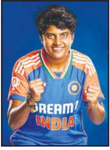
ଦୁଆବିଲ୍ଲା ଆଇସିସି ମହିଳା ୯୨୦ ବିଶ୍ୱକପ ୨୦୨୬ର ଗୁପ୍ତ ପର୍ଯ୍ୟାୟରୁ ବାଦ୍ ପଡ଼ିବା ପରେ ଭାରତୀୟ ମହିଳା କ୍ରିକେଟ ଦଳ ସମ୍ପୂର୍ଣ୍ଣରେ ବର୍ତ୍ତମାନ ନିଜକୁ ପ୍ରମାଣିତ କରିବାର ନୂଆ ବ୍ୟାଲେଜ୍ ରହିବ।

ଦୁଆବିଲ୍ଲା ଅନ୍ତର୍ଜାତୀୟ କ୍ରିକେଟ ପରିଷଦ (ଆଇସିସି) ମହିଳା ୯୨୦ ବିଶ୍ୱକପ ୨୦୨୬ ପାଇଁ ସର୍ବୋଚ୍ଚ ର୍ୟାଙ୍କିଂ ପ୍ରକାଶ କରିଛି। ଭାରତ ପ୍ରତିଯୁକ୍ତ ବିଶ୍ୱକପରୁ ବାଦ୍ ପଡ଼ିଛି, କିନ୍ତୁ ଶ୍ରୀ ଚରଣାଳୟ ପ୍ରଦର୍ଶନ ଉପରେ କୌଣସି ପ୍ରଭାବ ପଡ଼ିନାହିଁ। ଶ୍ରୀ ଚରଣ ବିଶ୍ୱର ନମ୍ବର ୧ ଓ ୨୦ ବୋଲର ହୋଇପାରିଛନ୍ତି।