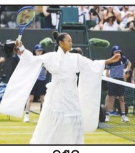
ଫୁଲ୍ ଡେଭଲପ୍ମେଣ୍ଟ ଓସାକାକ 'କିଲ୍ ବିଲ୍' ଚର୍ଚ୍ଚା ଫୁଲ୍ ଡେଭଲପ୍ମେଣ୍ଟ ଓସାକାକ 'କିଲ୍ ବିଲ୍' ଚର୍ଚ୍ଚା ଫୁଲ୍ ଡେଭଲପ୍ମେଣ୍ଟ ଓସାକାକ 'କିଲ୍ ବିଲ୍' ଚର୍ଚ୍ଚା