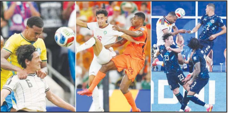
ଦୁଆବିଲ୍ଲା ଫିଫା ବିଶ୍ୱକପ ୨୦୨୬ରେ ଖେଳାଯାଇଥିବା 'ରାଉଣ୍ଡ ଅଫ୍ ୩୨' ମ୍ୟାଚ୍ ଗୁଡ଼ିକ ଅନ୍ତତଃ ରୋମାଞ୍ଚର ଭାବେ ଶେଷ ହୋଇଛି। ଶେଷ ମୁହୂର୍ତ୍ତର ଗୋଲ୍ ଏବଂ ଦୁଇଟି ବଡ଼ ପେନାଲ୍ଟି ସ୍ୱତଃ ଆଉଟ୍ ଗେମ୍ ଏହି ନିକଆଉଟ୍ ମୁକାବିଲାକୁ ଏତିହାସିକ କରିଦେଇଛି।

ଫିଫା ବିଶ୍ୱକପ ୨୦୨୬ରେ ଖେଳାଯାଇଥିବା 'ରାଉଣ୍ଡ ଅଫ୍ ୩୨' ମ୍ୟାଚ୍ ଗୁଡ଼ିକ ଅନ୍ତତଃ ରୋମାଞ୍ଚର ଭାବେ ଶେଷ ହୋଇଛି। ଶେଷ ମୁହୂର୍ତ୍ତର ଗୋଲ୍ ଏବଂ ଦୁଇଟି ବଡ଼ ପେନାଲ୍ଟି ସ୍ୱତଃ ଆଉଟ୍ ଗେମ୍ ଏହି ନିକଆଉଟ୍ ମୁକାବିଲାକୁ ଏତିହାସିକ କରିଦେଇଛି।