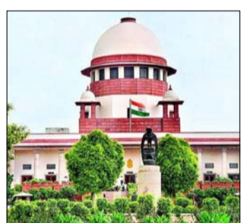
ଏକ ରାୟକୁ ବାତିଲ କରିଛନ୍ତି । ଅଦାଲତଙ୍କ ନଜରକୁ ଆସିଥିଲା ଯେ, ଏସେଲ୍ ଜନପ୍ରାୟୋକେଟ୍‌ସ୍ ଦେବାଜିଆ ପ୍ରକ୍ରିୟା ସମ୍ପର୍କିତ ମାମଲାରେ ଏମ୍‌ଏଲ୍‌ଏଆଇ ଦ୍ୱାରା ସୃଷ୍ଟି କେତେକ ନକଲି ଓ ଅସ୍ଥିତ୍ୱହୀନ ପୂର୍ବ ରାୟକୁ ଆଧାର କରି ନିଷ୍ପତ୍ତି ଦେଇଥିଲେ । ସୁପ୍ରିମକୋର୍ଟ କହିଛନ୍ତି, ଏପରି ତଥ୍ୟ ଉପରେ ଭରସା କରି ବିଚାରାଳୟର ରାୟ ନ୍ୟାୟ

ନୂଆଦିଲ୍ଲୀ, ୨।୭ ନ୍ୟାୟ ପ୍ରକ୍ରିୟାରେ କୃତ୍ରିମ ବୃଦ୍ଧିପା (ଏଆଇ)ର ଅନିୟମିତ ବ୍ୟବହାରକୁ ନେଇ ସୁପ୍ରିମକୋର୍ଟ ଗୁରୁତର ଉଦ୍‌ବେଗ ପ୍ରକାଶ କରିଛନ୍ତି । ଏକ ଗୁରୁତ୍ୱପୂର୍ଣ୍ଣ ରାୟରେ ଅଦାଲତ କହିଛନ୍ତି ଯେ, ଏଆଇ ଦ୍ୱାରା ସୃଷ୍ଟି ମିଥ୍ୟା, ଅସ୍ଥିତ୍ୱହୀନ କିମ୍ବା 'ହାଲୁସିନେସନ୍' ଆଧାରିତ ଆଇନଗତ ତଥ୍ୟକୁ ନ୍ୟାୟିକ ନିଷ୍ପତ୍ତିର ଆଧାର କରିବା ଅତ୍ୟନ୍ତ ବିପଜ୍ଜନକ । ଏଭଳି ପ୍ରକ୍ରିୟା ନ୍ୟାୟ ବ୍ୟବସ୍ଥାର ବିଶ୍ୱସନୀୟତା ଓ ନିଷ୍ପତ୍ତିଗତ ଗଭୀର ଭାବେ କ୍ଷତିଗ୍ରସ୍ତ କରିପାରେ । ନ୍ୟାୟପ୍ରକ୍ରିୟାରେ ଏଆଇର ବ୍ୟବହାରକୁ ନେଇ ସୁପ୍ରିମକୋର୍ଟ କଡ଼ା ସତର୍କବାଣୀ ଦେଇଛନ୍ତି । ଏଆଇର ବ୍ୟବହାରକୁ ନେଇ ସୁପ୍ରିମକୋର୍ଟ କହିଛନ୍ତି, ଏପରି ତଥ୍ୟ ଉପରେ ଆଧାର କରି ବିଚାରାଳୟର ରାୟ ନ୍ୟାୟ