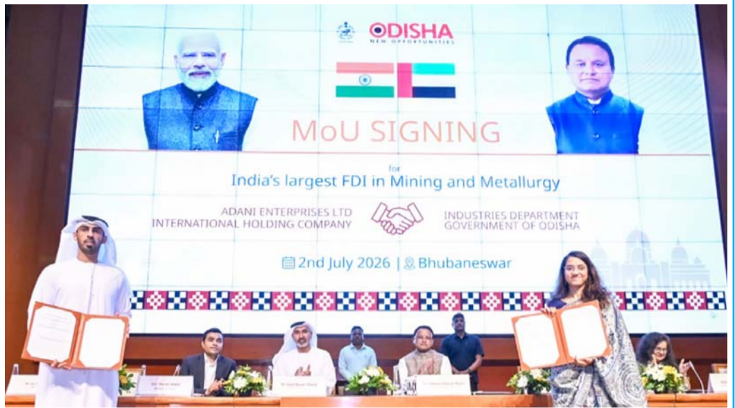
ଏହି ଅବସରରେ ମୁଖ୍ୟମନ୍ତ୍ରୀ ମୋହନ ଚରଣ ମାଝୀ ଯୋଗଦେଇ ୨୦୩୬୬ ଟଙ୍କା ଏକ ସମୃଦ୍ଧ, ଆଧୁନିକ ଓ ସମାଜିକ ଓଡ଼ିଶା ଗଠନ କରିବା ପାଇଁ ଆମର ଉଦ୍ୟମ ସଫଳତାର ସହ ଜାରି ରହିଛି ବୋଲି କହିଛନ୍ତି । ଓଡ଼ିଶାର ସମୃଦ୍ଧ ଓ ପ୍ରତିଭା ସହ ମଧ୍ୟ-ପ୍ରାଚ୍ୟର ପୁଞ୍ଜି ଓ ପ୍ରଯୁକ୍ତି ବିଦ୍ୟାର ସମନ୍ୱୟରେ ଏକ ସମୃଦ୍ଧ ପାର୍ଟିନରସିପ୍ ଗଠନ ହେବ ବୋଲି ଦୃଢ଼ ଆଶା ପ୍ରକଟ କରିଛନ୍ତି । ମୁଖ୍ୟମନ୍ତ୍ରୀ କହିଛନ୍ତି ଯେ, ଏହି ପ୍ରକଳ୍ପ ମାଧ୍ୟମରେ ଓଡ଼ିଶାରେ (ପୃଷ୍ଠା ୭ରେ)

ଭୁବନେଶ୍ୱର, ୨।୭ ଦୁଧିକ ଦୁଧିରୋ ଓଡ଼ିଶାକୁ ଏକ ଶିକ୍ଷିତ ସମୃଦ୍ଧ ଅର୍ଥନୀତିରେ ପରିଣତ କରିବା ଏବଂ ବିଶ୍ୱସ୍ତରୀୟ ପୁଞ୍ଜିନିବେଶକୁ ଆକୃଷ୍ଟ କରିବା ଦିଗରେ ଆଜି ରାଜ୍ୟ ଶିକ୍ଷିତ ଛାତ୍ରମାନଙ୍କର ଏକ ନୂତନ ଅଧ୍ୟାୟ ଯୋଡ଼ି ହୋଇଯାଇଛି । ଗୁରୁବାର ସ୍ଥାନୀୟ ଲୋକସେବା ଭବନ କନଭେନସନ୍ ସେଣ୍ଟରରେ ଆୟୋଜିତ, ଓଡ଼ିଶା ସରକାରଙ୍କ ଶିକ୍ଷା ପ୍ରୋତ୍ସାହନ ସଂସ୍ଥା 'ଇପିକଲ୍' ଏବଂ ସଂଯୁକ୍ତ ଆରବ ଏମିରେଟ୍ (ୟୁଏଇ)ର ପ୍ରତିଷ୍ଠିତ ବ୍ୟବସାୟିକ ପ୍ରତିଷ୍ଠାନ ଇଣ୍ଡସ୍ଟ୍ରିଆଲ୍ ଇନ୍ଫ୍ରାସ୍ଟ୍ରକ୍ଚର (ଆଇଏସ୍‌ସି) ପ୍ରତିଷ୍ଠାନର ସମ୍ମିଳନୀରେ ଏକ ମେଗା ସମ୍ମାନିତ ଆଲୁମିନିୟମ ପ୍ରକଳ୍ପ ପାଇଁ ଏକ ଗୁରୁତ୍ୱପୂର୍ଣ୍ଣ ଚୁକ୍ତିନାମା ପତ୍ର (ଏମସିୟୁ) ସ୍ୱାକ୍ଷରିତ ହୋଇଛି । ଏହି ପ୍ରସ୍ତାବିତ ପ୍ରକଳ୍ପରେ ପ୍ରାୟ ୧.୧୦ କୋଟି ଟଙ୍କାର ଆୟୋଜିତ ପ୍ରକଳ୍ପ ପାଇଁ ଏକ ଗୁରୁତ୍ୱପୂର୍ଣ୍ଣ ଚୁକ୍ତିନାମା ପତ୍ର (ଏମସିୟୁ) ସ୍ୱାକ୍ଷରିତ ହୋଇଛି ।