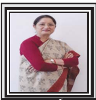
ଶ୍ରୀମତୀ ଅନୁପୂର୍ଣ୍ଣା ଦେବୀ କେନ୍ଦ୍ର ସରକାରରେ ମହିଳା ଓ ଶିଶୁ ବିକାଶ ମନ୍ତ୍ରୀ

ଆହାନ୍ତକୁ ପରିବର୍ତ୍ତନ କରିଥିଲା । ଏହା ବେଳେ ଏକ ଶବ୍ଦ ପରିବର୍ତ୍ତନ ନୁହେଁ, ବରଂ ଏକ ସଂକଳ୍ପର ପରିବର୍ତ୍ତନ । ମହିଳାମାନଙ୍କୁ କେବଳ ହିତାଧିକାରୀ ଭାବେ ବିବେଚନା ନ କରି ସେମାନଙ୍କୁ ନିଷ୍ପତ୍ତି ଗ୍ରହଣକାରୀ ଦୃଷ୍ଟିରେ ଦେଖାଯିବା ଉଚିତ୍ । ଆମେ କୋଟିକୁ ଯେଉଁ ପୁଣି ଆଣି ଆସିଛୁ, ତାହା ହେଉଛି ଏକ ଉଚିତ୍ ପରିବର୍ତ୍ତନ ମାର୍ଗକୁ ଅନୁକରଣ କରିବା । ଯେତେବେଳେ କୌଣସି ଏକ ପ୍ରତିଷ୍ଠା କରାଯାଏ, ଏହାକୁ କିପରି ଭାବେ ଆପଣମାନେ ପୂରଣ କରନ୍ତି । ମାତ୍ରରେ ହେଉ ଅବା ସେ ଅନ୍ୟ କୌଣସି ଉପାୟରେ ହେଉ ଏହା ସମାଜର ଶେଷତମ ମହିଳାଙ୍କ ନିକଟରେ ପହଞ୍ଚାଯିବା ଜରୁରୀ । ଭାରତ ଗତ ୧୦ ବର୍ଷ ଧରି ଏହି ଧାରାର ଉତ୍ତର ଦେଇ ଆସିଛି । କେବଳ ନାଟିକୁ ଅନୁସରଣ କରି ନୁହେଁ, ବାସ୍ତବତାକୁ ସ୍ୱୀକୃତ ଧାରଣ କରି ଏହା କାର୍ଯ୍ୟରେ ପ୍ରତିଫଳିତ ହୋଇଛି ।